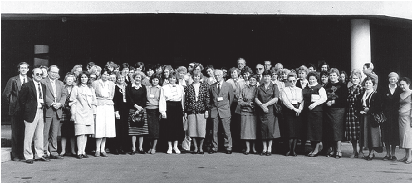
Foto 5. Eesti esimesest immunoloogide kongressist osavõtjad 1989. aastal.

Pärast seltsi loomist alustati hoogsalt ka ürituste korraldamist. 1986. aastal toimus Tallinnas vabariiklik immunoloogiakonverents. Konverentsist võttis osa peale Tallinna ja Tartu immunoloogide ka külalisi Moskvast, Leningradist, Riiast ja mujalt NSV Liidust (aga veel mitte välisriikidest). Konverentside teesides tutvustati 58 tööd, millest 30 pärines Eestist (23).