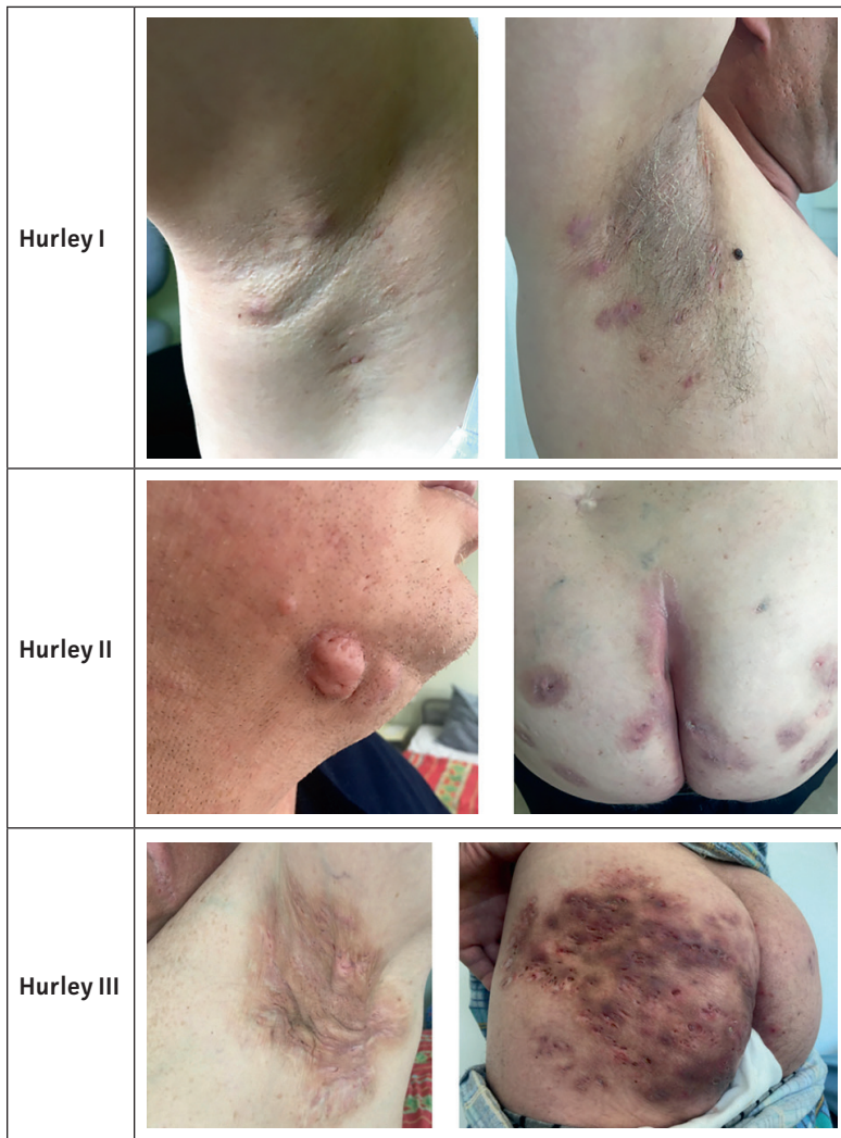
Joonis 1. Hidradentitis suppurativa raskusastmed Hurley järgi.

põhjalik analüüs, biopsiamaterjali histoloogiline uurimine, laboratoorsed analüüsid ning bakterioloogilised külvad.