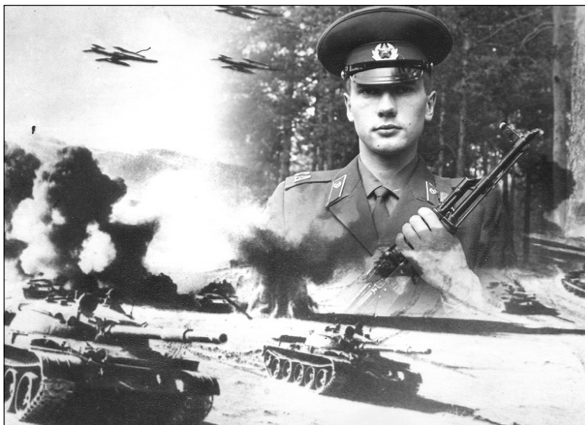
Joonis 1. Taolisi propagandakollaaže võis tellida väeosa fotograafilt.