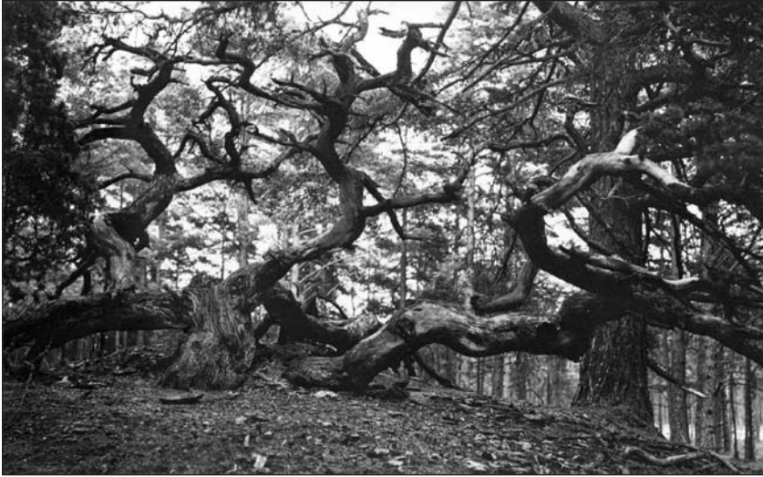
Foto 1. Muhu Madli määnd, Eesti Rahvamuseumi fotokogu, autor J. Saul, 1931.

On täiesti loogiline mõelda, et puusta naise nimetuse taga võisid peituda kõik eespool käsitletud normidest üleastunud naiste tüübid, sest põhjusi pagenduseks oli neil piisavalt. Könnumaal erakuna elava inimese puhul võis väga kergesti tekkida arvamus, et ta enda elatamiseks aeg-ajalt hundiks muundub. Seda uskumust toetas ka libahundipärimus, milles domineerisid eksistentsiaalsed, oma elujärje kergendamise eesmärgid. Kogu eelneva arutluse põhjal arvan, et libahunti tähistav termin puustre hunt , kuigi haruldane, ei tarvitse olla juhuslik, vaid selle taga on libahundikujutelm, mille tekkimisel võis toimida sama loogika, mis muinasfrankide ja -skandinaavlaste tavaõiguses samastas mütoloogilise libahundi lindpriiga, kes elas inimtühjas paigas eraldatuses. Sama võib välja lugeda ka Soome-Karjala pärimusest. Runod Lemminkäisest ja Tuurituisest jutustavad kogukonna norme rikkunud inimese – redutaja – saatusest. Soome-Karjala pärimuses kuulus mets inimühiskonnast väljaspoollisse ruumi. See ei olnud ainult üleloomulik ehk looduslikust tõelusest väljapoole jääv ja seda ületav supra naturam , vaid kogukonnast, selle moraalikoodist ja organisatsioonist väljaspool olev ruum, extra societatem . 187 Lemminkäist