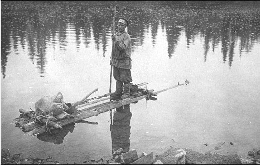
Joonis 5. Siberi maamõõtja teel tööle.

Eesti ajaloost teame, et talude kruntiajamine, millega kaasnes hoonete külast välja vedamine, tekitas kohati pahameelt ja vastuseisu. Valdavas osas Siberi vene külades jäigi see barjäär ületamata – küla lõhkumine üksiktaludeks olnud vene talupoegadele psühholoogiliselt vastuvõetamatu. Pere põllumaad mõõdeti küll (enam-vähem) ühte tükki, ent eluhood jäid küllasse, endisesse paika. Nii tekkisid lahktalud. Sellise maakasutusviisi negatiivseks jooneks loeti suuri vahemaid – mõne pere põllud jäid kodust 5–7 km kaugusele.