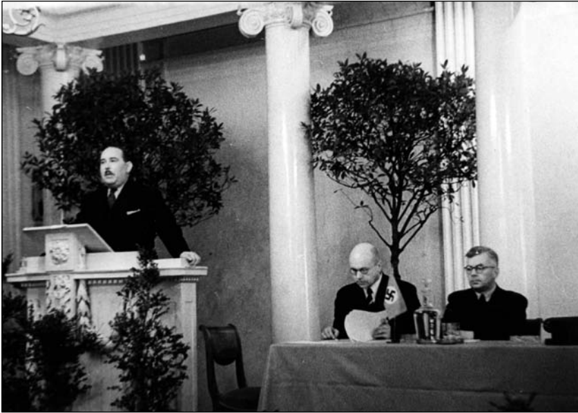
Joonis 2. Eesti omavalitsuse juht Hjalmar Mäe kõneleb vallavanemate nõupidamisel Tartu ülikooli aulas. Paremalt esimene sisedirektor Oskar Angelus.

said Mäest ja Angelusest oponentid ning juba paguluses on nende tegevuses näha üksteise mittedallimist. Samuti kirjutab Mäe oma mälestuses 1941. aasta keskpaiga kohta järgmist: “Tallinnas tuli aga minu juurde [...] delegatsioon [...], kes esitas mulle kirjaliku nõudmise, et mina oma kaasvõitlejaid vabadussõjalasi laseks võtta osa valitsemisest, et ma moodustaks enda juures neist nõuandva kogu ning paneks määravatele kohtadele vaid vabadussõjalasi. [...] Ma lõin Rahvakasvatuse talituse, kuhu andsin tööd kõigile vabadussõjalastele, kel ülalpidamist polnud.” 9 Ka diplomaat ja endine välisministeeriumi kaastööline ning omavalitsuse kohtudirektor Oskar Öpik (pseud. Oskar Mamers) kirjutas oma mälestustes olukorrast omavalitsuses selle viimastel päevadel 1944. aastal: “[...] direktorid, kes olid [Mäe] kaaslaste hulka pääsenud kas selle tõttu, et olid vapsid või teiste inimeste puudumisel, olid nüüd arvatavasti Mäe silmis inimesed, kellelt suurt tuge ja tarka nõu oli asjata oodata.” 10