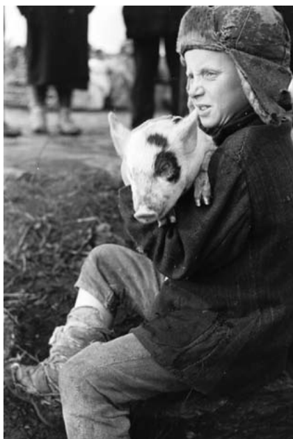
Joonis 3. Peipsitaguste eestlaste-sõjapõgenike vastuvõtmine Võõpsus. Sügis 1943.