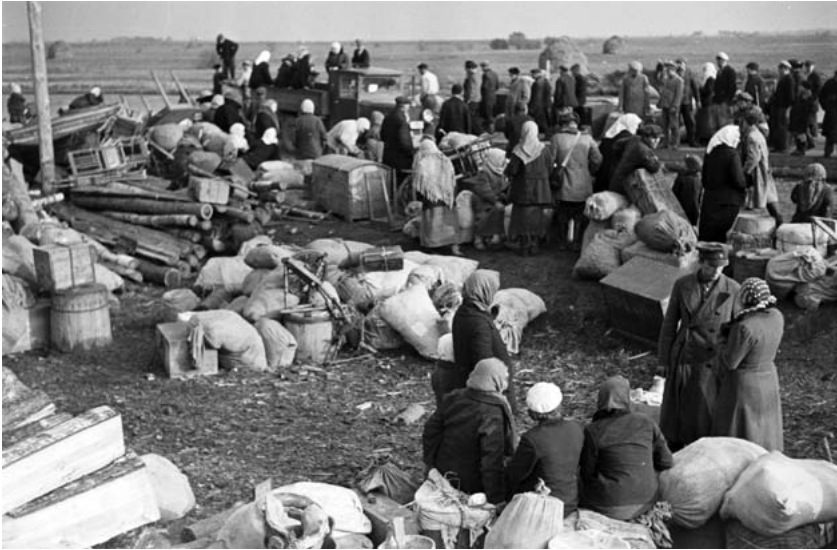
Joonis 2. Peipsitaguste eestlaste-sõjapõgenike vastuvõtmine Võõpsus. Sügis 1943.