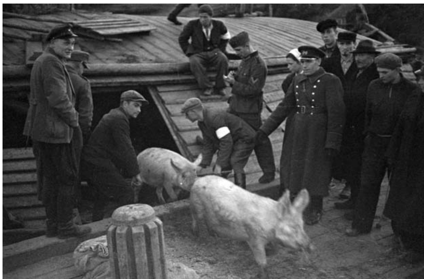
Joonis 4. Peipsitaguste põgenike päralejõudmine Mustvees. Loomade väljalaadimine lotjadest.

Ingerimaal algas eestlaste evakueerimine 6. oktoobril 1943, ümberasujad suunati Eestisse Jamburgi ja Narva kaudu. Karantiin Narvas kestis u neli päeva, mille jooksul vormistati piiriületusload sisemaale liikumiseks. Eesti territooriumil hakkas põgenikke toitlustama Eesti Rahva Ühisabi, 88 sinnani tuli hakkama saada oma toidumoonaga. Narva jaama läbis päevas 4–5 evakueeritute ešeloni, iga ešelon koosnes tuhandest kuni paarist tuhandest inimesest. Pärast Narva läbikäigulaagrit võisid need, kel oli maapiirkondades sugulasi, nende juurde asuda, ülejäänud transporditi Tapa põgenikelaagrisse või Paldiskisse, kus venelased eraldati eestlastest ja ingerisoomlastest. 89 Kokku saadeti Gatšinast ja sealsetest ümbruskaudsetest taludest ära 253 eestlast ja 18 lätlast-leedulast ning 292 ingerisoom-