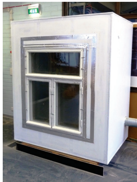
Foto 1. Katseaken survekapis.

Akna soojustehnilist toimimist mõjutab mitu konstruktsioonilist lahendust. Katseakna konstruktsioonid vastavad põhiosale ajavahemikus 1880–1940 valmistatud akendele. Neil on eraldi leng, mis on jaotatud ristkarmiks, T-karmiks või püstjaotusega karmiks. Aknad on kahe klaasiga ning põhimõtteliselt sisse ja välja avanevad või ainult sisse avanevad. Raamid on jagatud osadeks või mitte. Raamil