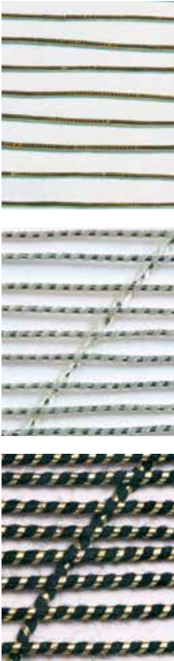
Fotod 8–10. Mähitud metallniidid: metall-lint on ümber niidi mähitud tihedalt; metall-leht on ümber niidi mähitud hõredalt; metall-leht on ümber niidi mähitud väga hõredalt. Allikas: Stang et al. 2013: 58. J. Kuckla fotod.