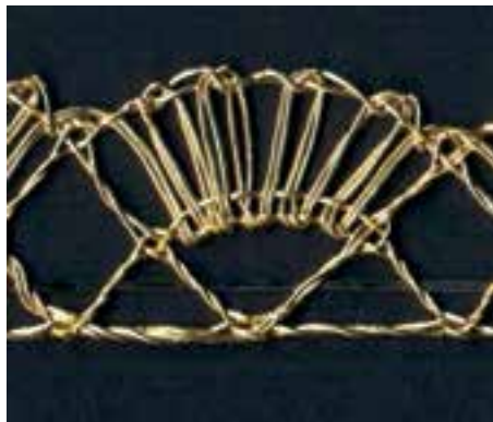
Fotod 5–6. Käina raagtanu (ERM A 716:105) pitsi fragment. Vasakul vana, paremal uus pits.