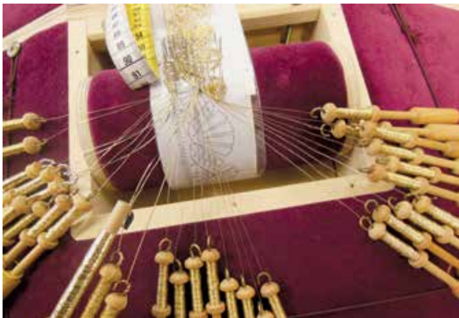
Foto 12. Pooleli olev metallniplispits padjal.

Metallpitsi on parem niplata rullpadjal. Sobib ka n-ö Soome tüüpi padi. Fotol 12 on näha pooleli olev metallniplispits. Oluline on, et pulgad oleksid rippuvas asendis ja pulkade loomuliku raskuse toimel oleks niit võimalikult pinges.