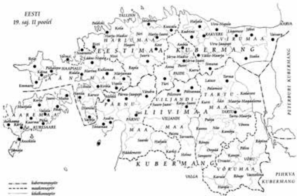
Joonis 1. • Metallniplispsiga esemete levik Eestis. Angelika Nõpsi joonis.

kauplemise koht, mistõttu jõudsid kaubad kas Tallinna, Riia või Venemaa kaudu ka Tartu turule.