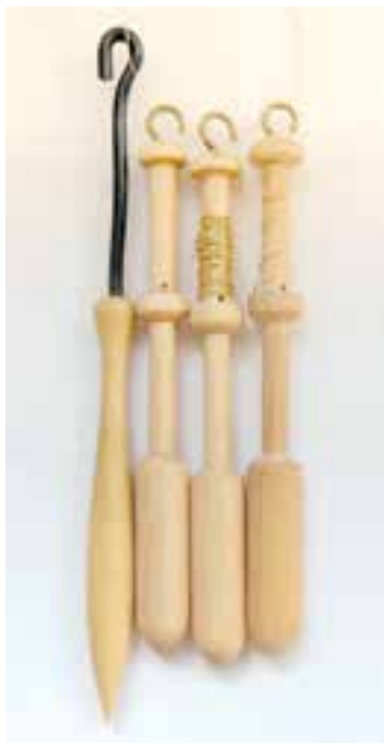
Foto 11. Metallniplispitsi pulgad.

Kui mähitud niite tuleb hinnata silma järgi ning võrreldes, siis leht-metalli number näitab lehe laiust, mida saab mõõta digitaalse nihkkaliibri abil. Kõik materjalid on nikeldatud vastavalt kuldseks ( nickel-gold ) või hõbedaseks ( nickel-silber ).