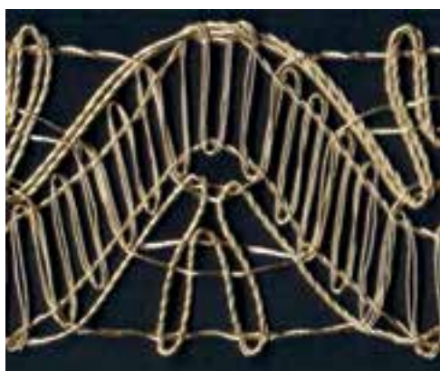
Fotod 1–2. Vaivara käiste (ERM 15514) pitsi fragment. Vasakul vana pits, paremal uus pits.