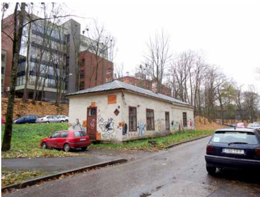
Illustratsioon 5. Tartu ülikooli veevärgi pumbamaja