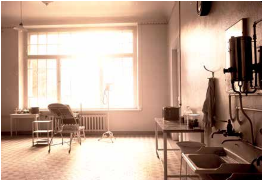
Illustratsioon 4. Tartu ülikooli naistekliiniku sisevaade 20. sajandi algul, näha on kraanid