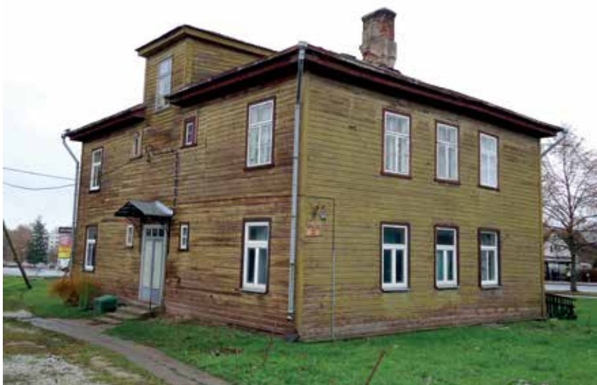
Illustratsioon 6. Pudretivabriku tööliste maja (arhitekt A. Podšekajev, 1895) on tänaseni alles Jaama tn ja Sõpruse pst ristmiku lähedal.