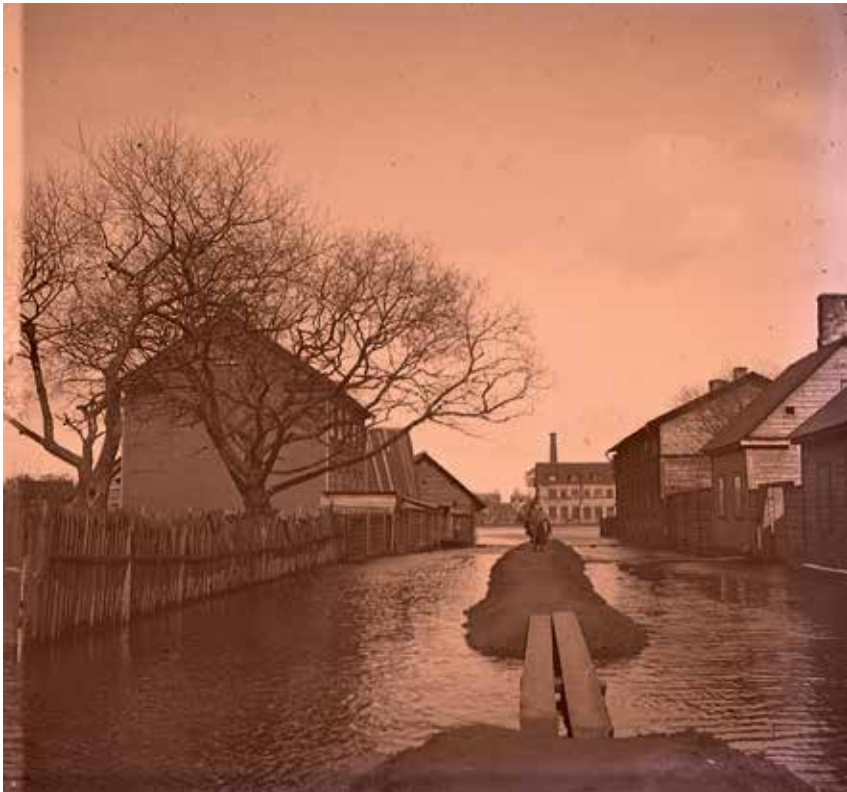
Illustratsioon 1. Üleujutus Pärmivabriku kandis 1899. aasta kevadel

Körberi kirjeldustest on näha, et linna reovete ärajuhtimine kujutas endast tõsist probleemi ning kõiki rahuldav ja toimiv lahendus oli sajandivahetusel veel leidmata. Fortuuna tänava piirkonna perioodilised üleujutused jätkusid tegelikult kuni 1960. aastateni. Tüüfus oli selle piirkonna endeemiline haigus.