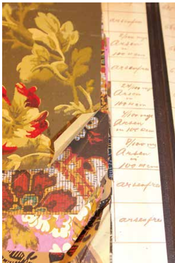
Foto 4. Tapeediproovid, mille arseenisisaldust on analüüsitud.