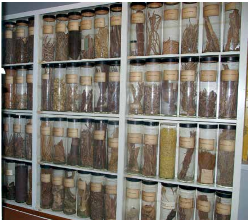
Foto 1. Droogide kollektsioon TÜ ajaloo muuseumis (ÜAM-1340:1-720; ÜAM-1412:1-578)