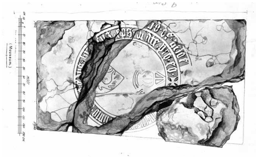
Foto 6. Tartu piiskopi Henrich von der Velde hauuplaat, 1928 (TÜ KM, JO 492).