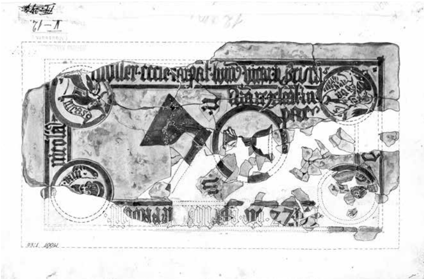
Foto 5. Vikaar Nicolaus Molleri hauaplaat Tartu toomkirikust, 1928 (TÜ KM, JO 491).