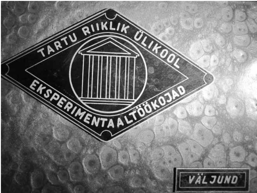
Foto 3. Detail näituselt „Tehtud Tartus“ – Tartu Ülikooli eksperimentaaltöökoad firmamärk.