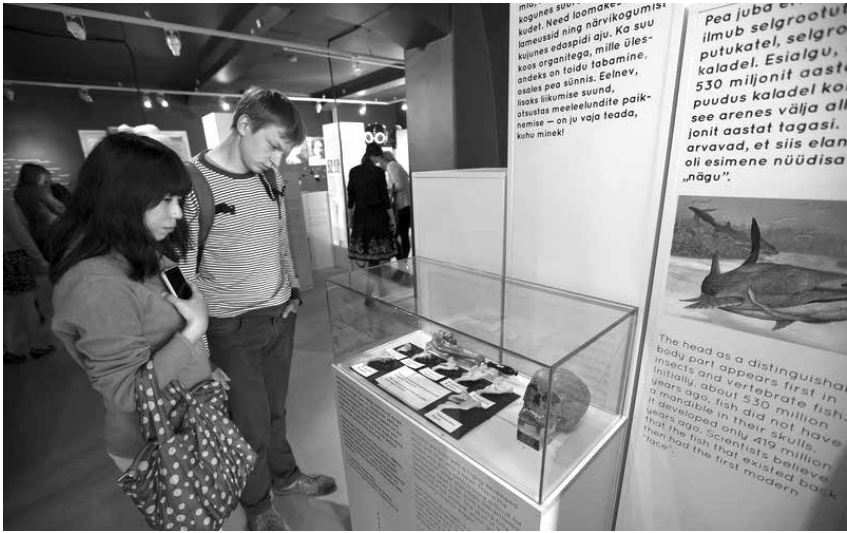
Foto 1. Näituse PEA ASI avamine 25. aprillil 2014.