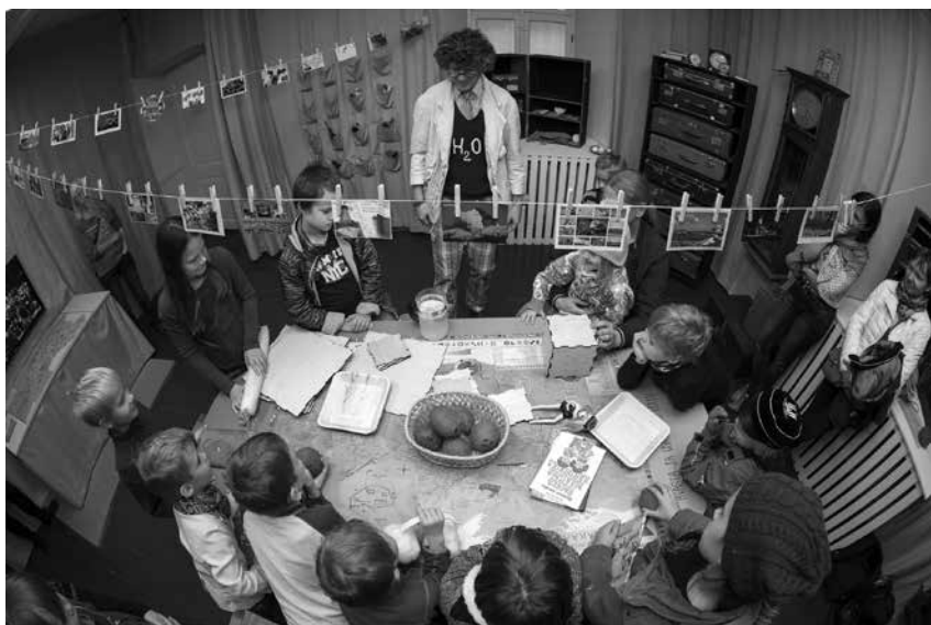
Foto 5. Remondi töttu suletud Hullu Teadlase kabineti asemel avati 10. oktoobril tähetorni kellatoas Hullu Teadlase maailma mõõtmise jaam.

rammi (osalejaid 1731) ja 14 käelise tegevuse programmi (osalejaid 152). Populaarseim põhikooli programm oli „Vana-Kreeka kultuur“, populaarseimad gümnaasiumiprogrammid olid „Vana-Kreeka kunst“ ja „Vana-Kreeka kirjandus“.