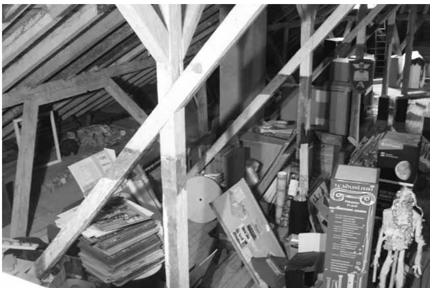
Foto 3. Aastate jooksul toomkiriku pööningule kogunenud vara – peamiselt vanad näitused ja näituste tarvikud – koristati ühiste talgutöödega mõne päevaga.