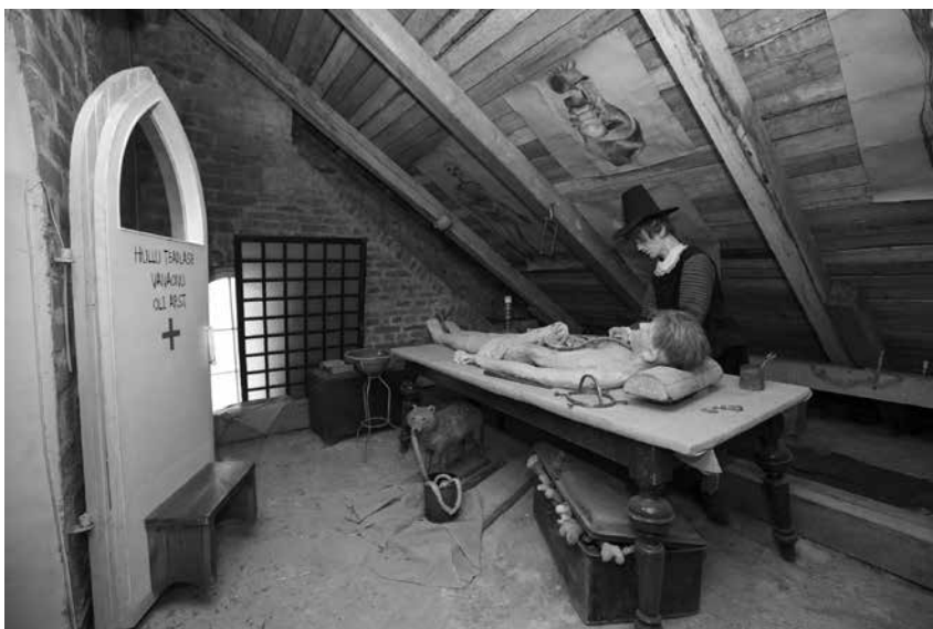
Foto 2. Toomkiriku katusealustest kadusid alkeemiku töötuba ja lahkamiskamber.