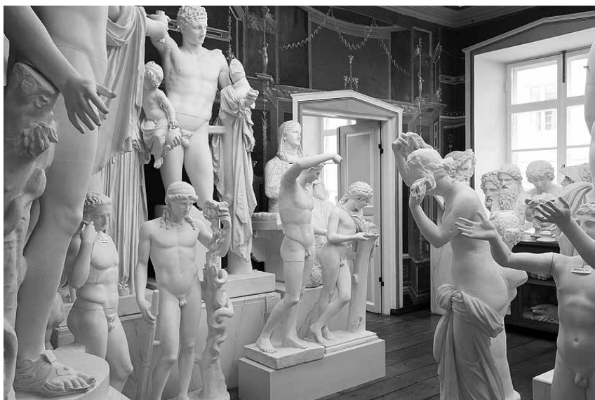
Foto 1. Kunstimuuseumi antiigihoidla remondi ajal tuli tihendada ekspositsiooni, nii sündis näitus „Skulptuurimets“.

teiste seas Tartu Ülikooli ajaloolise arhitektuuriansambli. Seni oli märgis antud ühtekokku kahekümnele Euroopa Liidu kultuuripärandi objektile. Eestist on varem märgise pälvinud Suurgildi hoone Tallinnas (2014). Tartu Ülikooli ajaloolise arhitektuuriansambli puhul tõstis žürii esile, et säilinud hoonestu koos pargi ja kollektsioonidega kannab endas harmoonilise tervikuna valgustusajastu ülikooli ideed ja ideaale ning euroopaliku hariduse traditsioone. Märgis anti ülikooli muuseumi esindajale pidulikult üle 2016. aasta aprillis Brüsselis.