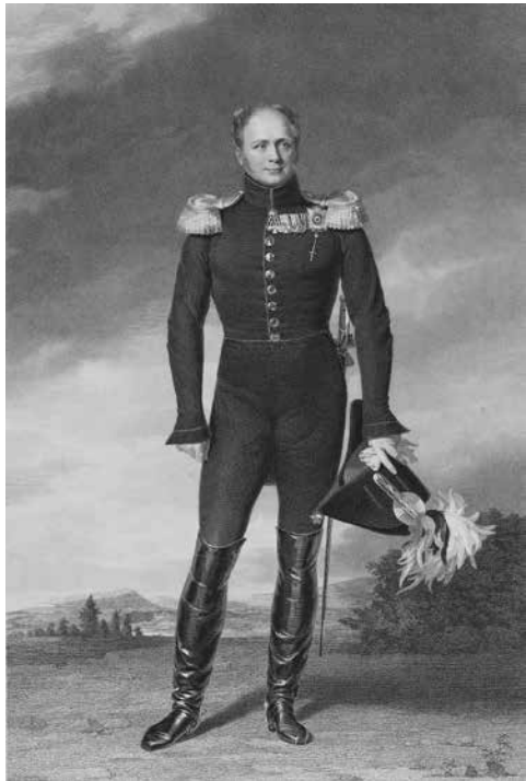
Joonis 4. Thomas Wright (Georg Dawe järgi). Aleksander I portree. Vasegravüür, 1826 (Tartu Ülikooli raamatukogu, ÜR 521)