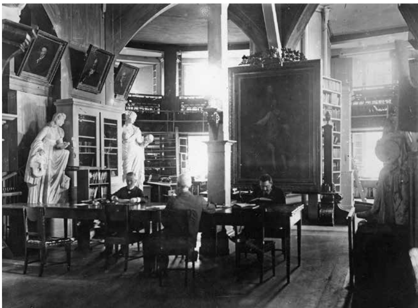
Joonis 5. Tartu ülikooli raamatukogu lugemissaal 1910. aastal (Eesti Filmiarhiiv, f. 197, foto nr 0-29813).

habemeta ja heledate juustega nägu võiks võrrelda Apolloniga; paremal servas võiks ehk aimata ka samba kujutist. Seega: kuigi meil pole võrdlemiseks võimalik kasutada teist fotot või gravüüri ja ka foto allkiri ei viita kuidagi pildil kujutatud kunstiteostele, saab üsna julgelt väita, et oleme tuvastanud ainsa seni teadaoleva foto Tartu ülikoolile kuulunud Kügelgeni maalitud Aleksander I portreest. Kügelgeni maal oli seega 19. sajandi teisest poolest kuni Esimese maailmasõjani üles seatud raamatukogu ruumides (praeguses ülikooli muuseumi valges saalis). Võib-olla seadis raamatukoguhoidja teadlikult Gerhard von Kügelgeni tööd ligistikku?