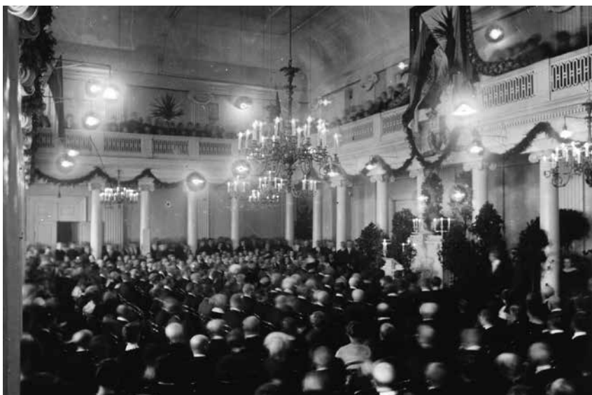
Joonis 2. Emakeelse ülikooli avaaktus 1. detsembril 1919 ülikooli aulas