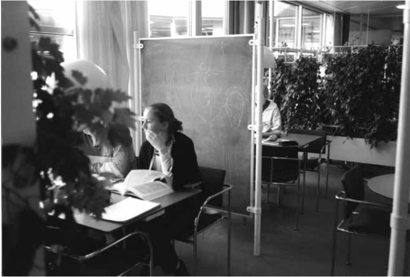
Fotod 3. Rühmatöö Odense ülikooli kliinilise biokeemia ja geneetika osakonnas: individuaalne valmistumine.

Olukord paranes, kui tekkisid otsekontaktid saajate ja doonorite vahel. Kuopio ülikooli saadetised erinesid teistest väga palju, sest saadetav aparatuur oli remonditud ja korraldati ka töötajate väljaõpe.