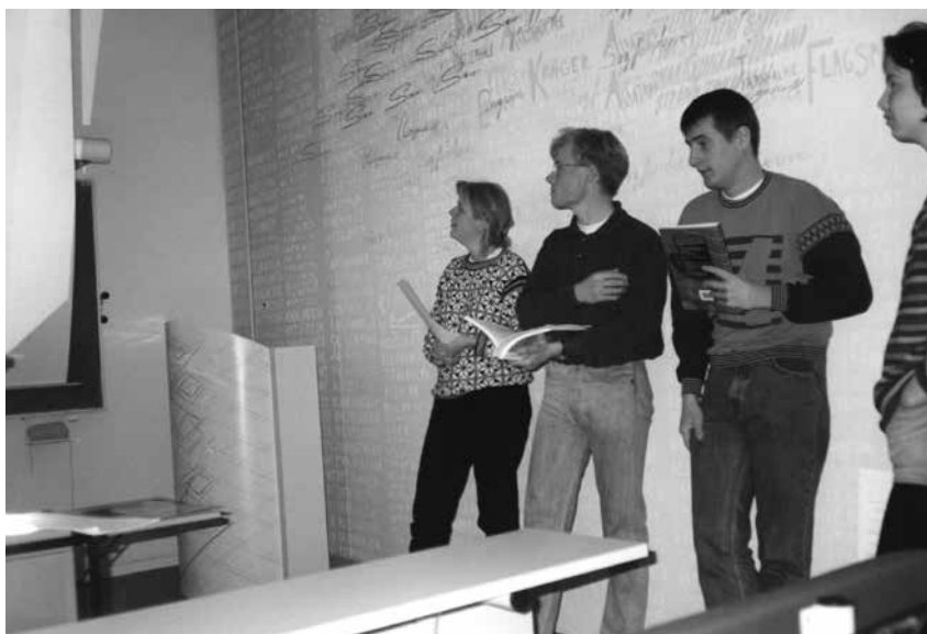
Foto 4. Rühmatöö Odense ülikooli kliinilise biokeemia ja geneetika osakonnas: tulemuste ettekandmine seminaris.

kliiniline ja pikaajalise väljaõppega (9–11 a) nagu Põhjamaades. Füüsika-keemiateaduskonna keemiaosakond oli valmis alustama esimest varianti, kuid arstiteaduskond sellist ei pooldanud. Lõppotsus oli: kujundada sellest arstlik eriala. Algul kliiniliseks keemiaks nimetatud erialal fikseeriti residentuuri õppeajaks kolm aastat, see-ga eriarsti diplomini ühtekokku 6+1+3=10 aastat. Sellist residentuuri kestust nimetas välisaudiitor ikka veel liiga lühikeseks (võrreldes Põhjamaade praktikaga). 1997. aastal õnnestuski teaduskonnal seda aega neljale aastale pikendada.