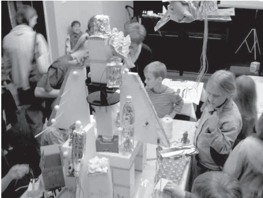
Foto 2. 2009. aasta teadlaste ööl loodi muuseumi kohvikus enneolematuid kosmosemasinaid