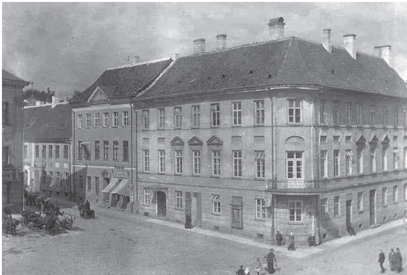
Illustratsioon 4. Suurturu-äärne vana ülikoolimaja 1870. aastal