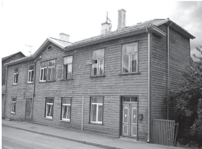
Illustratsioon 1. Jaama 27 maja, millel oli aastakümneid ees arvatav vana ülikoolimaja uks, tänapäeval majal ees olev mehepeadega uks on vana ukse koopia (Foto: Egle Tamm, 2011)

tänava nurgamaja (Raekoja plats 6 / Rüütli 2). Von Bocki maja sai ülikool esimesed viis õppeaastat kasutada tasuta ja seal avatigi ülikool 1802. aasta kevadel. Hiljem maja renditi ja 1839. aastal ostis ülikool maja endale. 3 Raekoja platsi äärset maamarssal von Ungern-Sternbergi maja algul renditi, kuid juba 1802. aasta sügisel sai ülikool maja omanikuks. 4 Seda maja nimetati akadeemiliseks majaks. Mõnda aega pärast praeguse peahoone valmimist oli kasutusel ka nimetus „esialgne maja” ( Interims-Gebäude ). 5 Arhiividokumentides ja mitteametlikus keelepruugis oli levinud nimetus „ülikoolimaja Suurturu ääres” ja hiljem „vana ülikoolimaja Suurturu ääres”. 6