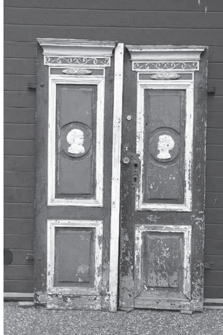
Illustratsioon 2. Jaama 27 maja ees olnud uks (Foto: Toomas Tamm, 2011)

hepeades näha Platonit (surnud 347 eKr) ja Aristotelest (384–322 eKr) kui antiikaja tuntuimat õpetaja ja õpilase paari. Mõtet, et kujutatud on antiikfilosoofe, toetab ka K. Morgensterni kui akadeemilise maja hinge suur huvi ja austus antiikfilosoofide vastu. Kui Morgenstern õppis Halle ülikoolis, oli Platon stuudiumi peamine uurimisobjekt. Samuti olvad Morgenstern kandnud sõrmes Sokratese pea kujutisega kaunistatud oonüks-sõrmust. 16 Semantilisel see akadeemilise maja täpne ja sobiv sümbol, väljendades ajastu filosoofilisi suundumusi ja mõttemaailma.