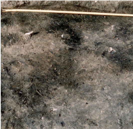
Abb. 2. Rußiger Erde auf dem gewachsene Boden.

Jn 2. Tahmase mulla laigid looduslikul põhjakihil.