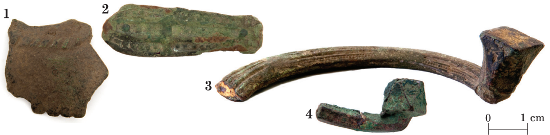
Abb. 3. Funde von Uugla. 1 – Fragment eines Anhängers, 2 – fischförmiger Beschlag, 3 – Fragment einer Hufeisenfibel, 4 – Endknopf einer Hufeisenfibel.

Jn 3. Leide Uuglast. 1 – ripatsi katke, 2 – kalakujuline ripats, 3 – hoburaudsõle katkend, 4 – hoburaudsõle napp.