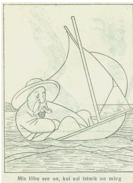
Mis lõbu see on, kui sul istmik on märg

Teisalt võib Tartu seltsi vähese esilekerkimise põhjuseks (aga ka tallinlaste 1930. aastail vähenenud aktiivsuseks) olla just nimelt muutunud olukord kodumaise arstinduse ja tervishoiu arengus. 1934. aasta järel autoritaarseks muutunud riigivõim asus kujundama vertikaalset võimukorraldust. N-ö altpoolt lähtuvat initsiatiivi esindavad liikumised kaotasid oma tähtsuse. Tekkis keskne ja kõigile praktiseerijatele kohustuslik arste riigivõimu ees esindav Arstide Koda ning kõikvõimalikud arstide