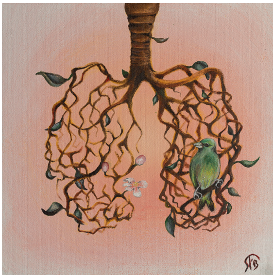
Signe Toom. Öitseng. I koht