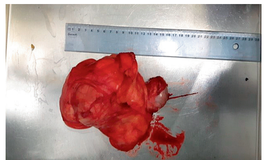
Pilt 2. Tuumor koos parempoolse testis 'ega.