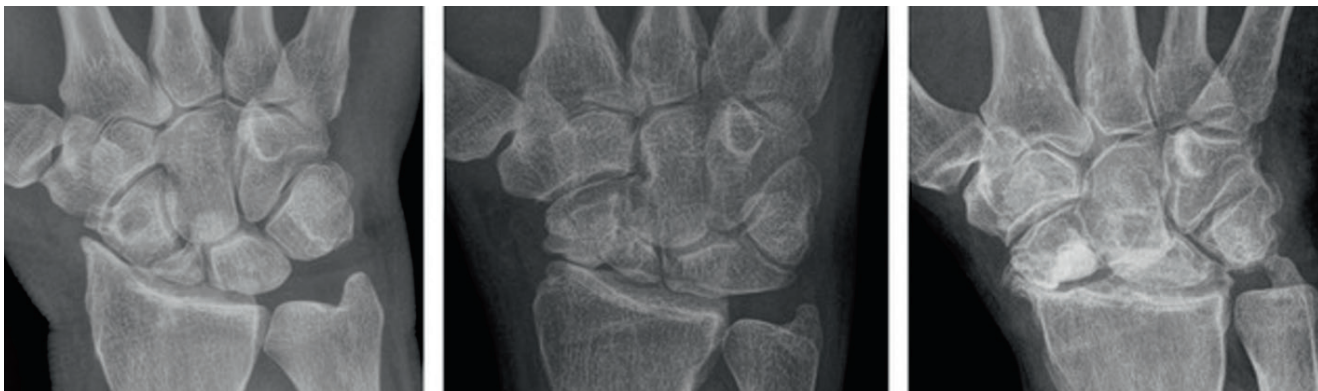
Pilt 2. Röntgeniülesvõtted posttraumaatilise artroosiga randmetest lodiluu eballiigese korral ( scaphoid nonunion advanced collapse – SNAC).