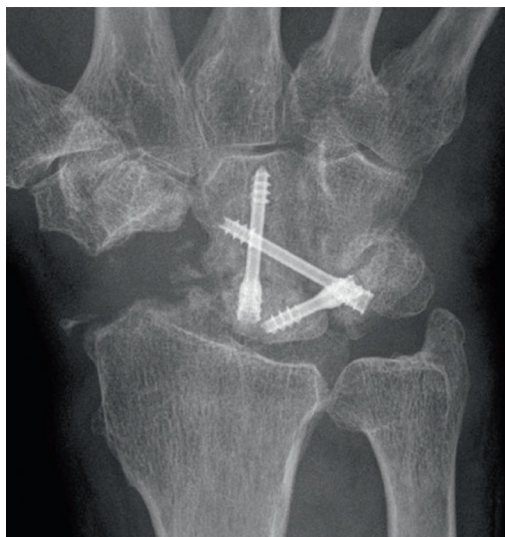
Pilt 4. Röntgeniülesvõte randmest pärast lodiluu eemaldamist ja kuuluu-päitluu-konksluu-kolmkantluu artrodees.

sekundaarsed degeneratiivsed muutused kuuluu ja kodarluu vahelises liigeses.