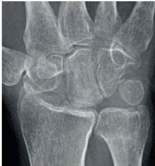
Pilt 3. Röntgeniülesvõte randmest pärast proksimaalsete randmeluude eemaldamist.

Võimalikud tüsistused nelja nurga artrodeesi korral on luude mitteühinemine ning