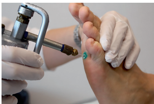
Foto 2. Pihustamistehnika krüokannuga