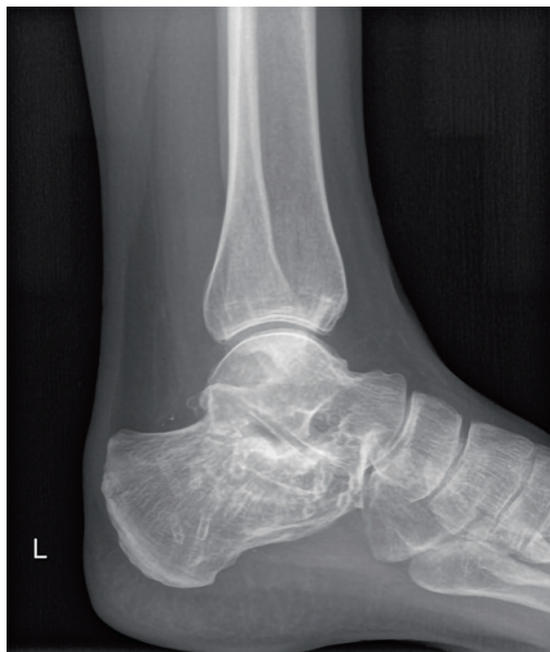
Pilt 3. Röntgeniülevõte. Alumise hüppeliigese postraumaatilise osteoartritis tunnused kandluumurru järel.