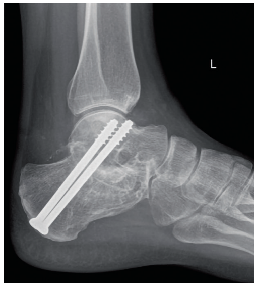
Pilt 5. Subtaalarliigese fikseerimine kahe kruviga, operatsioonijärgne röntgenpild.

raste kasutamisel on võimalik kaameraga ja röntgeniaparatuuriga jälgida varraste õiget asendit liigese sees. Juhtevarraste ja kruvide lõplikku positsiooni ning pikkust hinnatakse operatsioonitoa mobiilse röntgeniaparatuuri abil. Fiksatsioon ja kompressioon kahe luu vahel on samuti kaameraga jälgitav ja hinnatav. Operatsioon lõpeb portaaliavade sulgemisega ning hüppeliigese immobiliseerimisega, fikseerimisega operatsioonilaual kipslahasesse. Kasutada võib ka inversiooni-eversiooni ja ekstensiooni-fleksiooni suunda piiravat ortoosi.