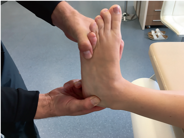
Pilt 2. Alumise hüppeliigese testimine. Provotseeritud inversioon koos rotatsiooniliigutusega kutsub esile valu alumise hüppeliigese välis- ja/või siseküljel alumise hüppeliigese projektsioonil.

Suurte luuliste deformatsioonide ning mitmete hüppeliigese- ja keskpöiapiirkonna liigete haaratuse korral osteoartritisiga