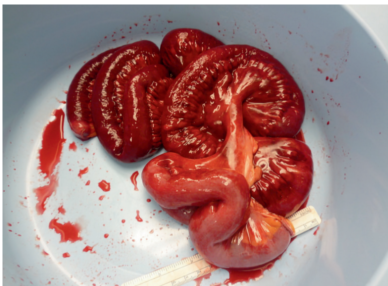
Pilt 1. Embolist tingitud ägeda mesenteriaalse isheemia tõttu resetseeritud peensoole segment.

Nekrootilise soole pikkus otsustab ära sooleresektsiooni ulatuse. Soole eluvõimelisuse hindamine on raske, selleks on viimasel ajal soovitatud otsuse tegemisel lisaks visuaalsele hindamisele kasutada operatsiooniaegset Doppleri ultraheliuuringut, mis sedastaks pulseeriva verevoolu soolekinnistis, ja ka fluorestseiniitesti (16, 21). Kui leid kirurgilise sekkumise käigus viitab soole hüpoperfusiooni vähenemisele ning verevarustuse paranemine omakorda soole võimalikule eluvõimelisusele, tehakse sageli 24 tunni jooksul kordusoperatsioon (ingl second-look ), mille käigus võetakse vastu lõplik otsus resetseerida kahjustatud soolesegment (vt pilt 1) või katkestada edasine aktiivravi.