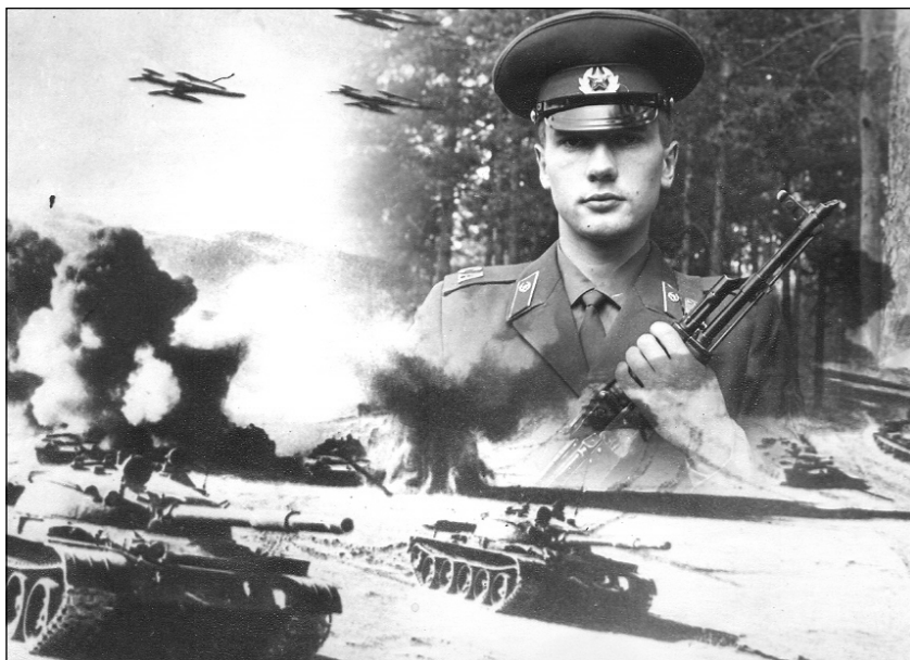
Joonis 1. Taolisi propagandakollaaže võis tellida väeosa fotograafilt.