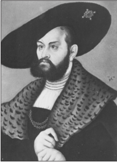
Joonis 1. Albrecht von Brandenburg-Ansbach (Lukas Cranach vanema 1533. aasta maal).