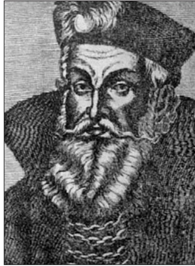
Joonis 2. Wilhelm von Brandenburg-Ansbach (anonüümse autori gravüür 16. sajandist).

suhted jäid usalduslikeks, lisaks olid mõlemad usupuhastuse veendunud pooldajad. Seetõttu sai Wilhelmist lõpuks ikkagi Albrechti Liivimaa-politiika elluviija. Ka markkrahvi dünastiline baas oli selleks sobilik: lisaks Poola kuningast onule olid tema vend Georg Ansbachi ja onupoeg Joachim I Brandenburgi markkrahv, viimase vend Albrecht aga Mainzi kuurvürst ja Saksamaa priimas. Peale selle olid Wilhelmil hertsog Albrechti abielu kaudu Frederik I tütre Dorotheaga soojad suhted ka Taani kuningakojaga.