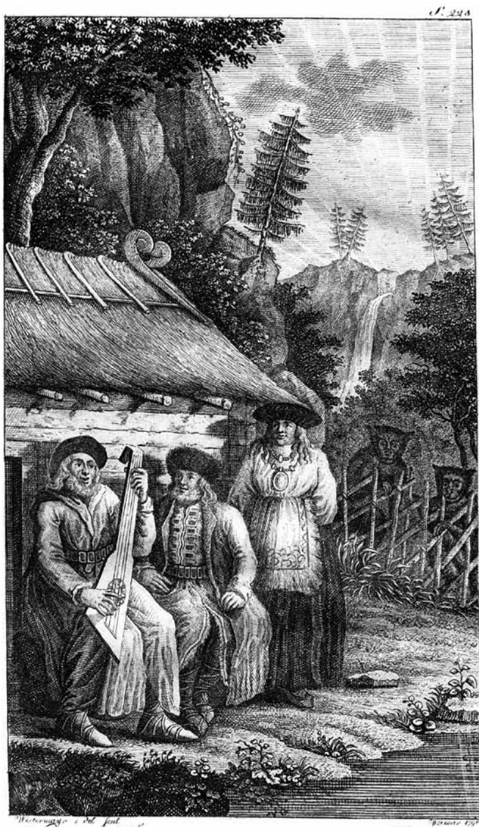
Wäina - Mäinen, Orpheus der Finnen.

Joonis 1. Wäinämöinen – soomlaste Orfeus. Interpretatio antiqua kasutamine oli 18.–19. sajandi mütoloogia põhiline meetoodika (illustatsioon raamatust Merkel, Die Vorzeit Lieflands ).