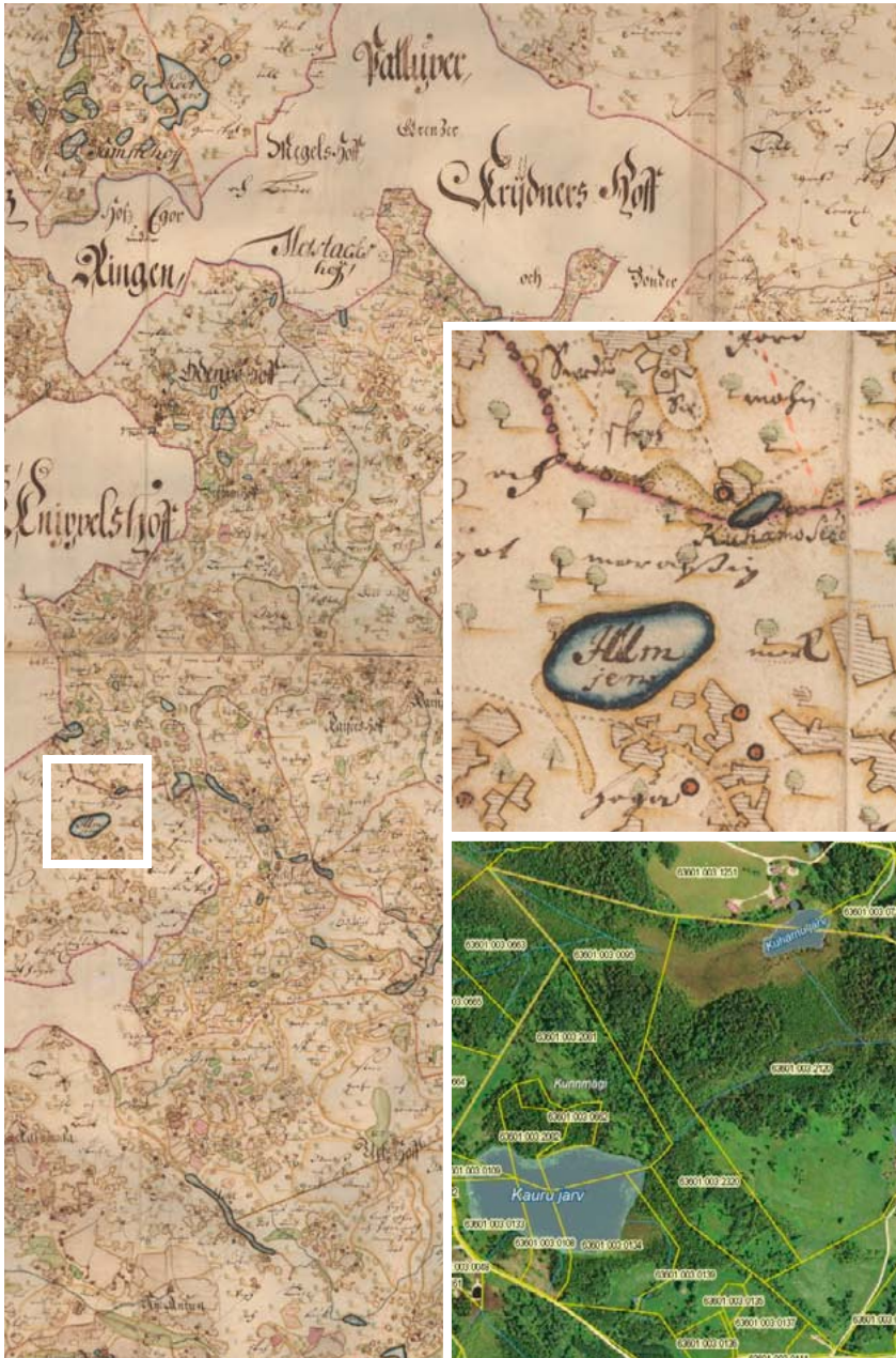
Joonis 8. 1685. aasta kaart (EAA, f. 308, n. 2, s. 88), mis kinnitab Kauru järve ja Ilmjärve samasust, kõrvutatuna Maa-ameti tänapäevase kaardiga.