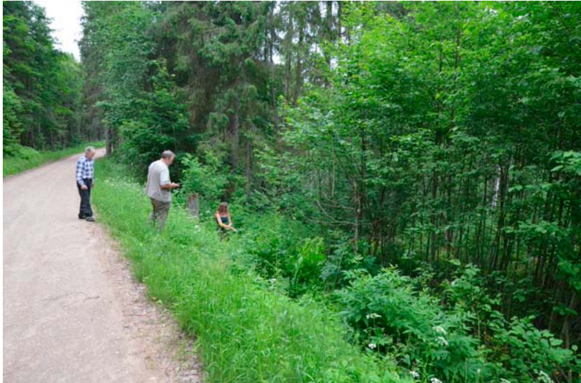
Joonis 5. Pühalätte ligikaudne asukoht teeäärsel nõlvakul. Foto Mari-Ann Rimmel (2013).

võib tõmmata paralleele matuste ajal puutüvesse risti lõikamise kombega – muistse tavaga, mida senini järgitakse mitmes Võrumaa kihelkonnas. 67