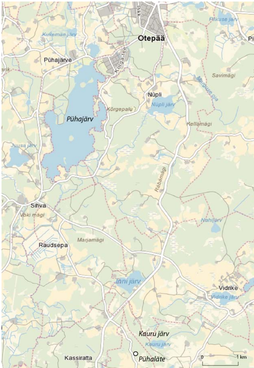
Joonis 2. Pühalätte ja Kauru järve asukoht Otepää suhtes. Kaardialus Maa-ameti teostus Maria Smirnova.