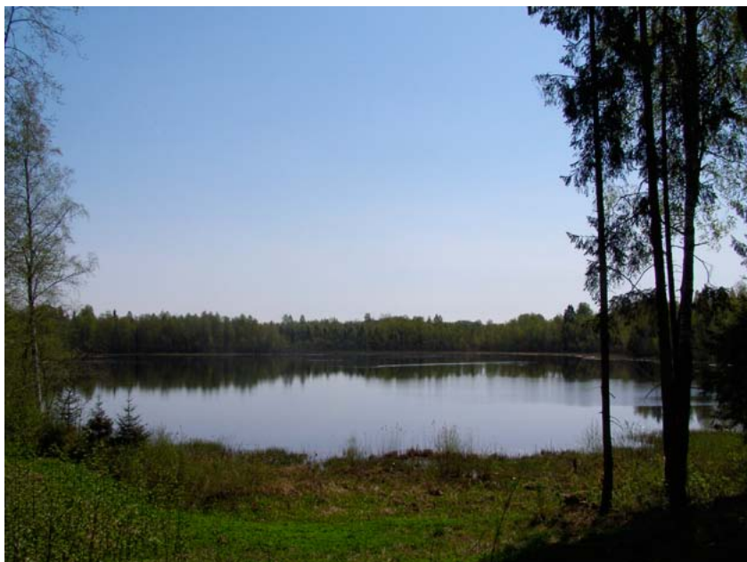
Joonis 7. Praegune Kauru järv, endine Ilmjärv. Siia ohverdati Possevino teatel varastatud lapsi või laste verd. Foto Heiki Valk (2013).

vastas, 94 kuid see samastus on ekslik ja sekundaarne – nähtavasti Ilmjärve kooli nimest tuletatud. Endise Ilmjärve kooli vastas olev Kolju järv kujutab endast alles hiljuti rajatud paisjärve, mida Ilmjärve mõisa 1832., 1861. ja 1906. aasta kaartidel 95 veel ei ole.