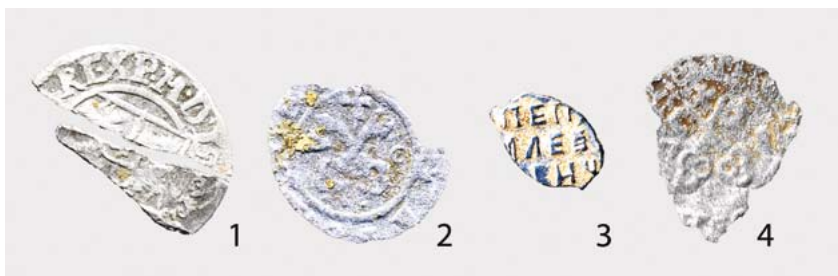
Joonis 6. Ohvrimündid Pühälätte ümbrusest. Skaneering Heiki Valk, töötlus Maria Smirnova.

raiumiskeelust allika ümbruses ning 1939. aasta mäрге Pühälattest algava kraavi ääres kasvanud vanade kaskede pühadusest. Ümbruskonna mikrotoponüümika – nii Pühälätte mäe kui ka läheduses oleva Pühikmäe nimi (nagu märgitud, kajastub see piirkonna vanimal, 1825. aastast pärit mõisakaardil Puhha nime all) viitavad aga suuremale pühale alale. Laiema piirkonna kunagisele, väga vana algpäraga sakraalsusele võib viidata ka Kolju talu ja sellest tulenenud Kolju küla nimetus. Nii Eestis 72 kui ka Soomes 73 viitab kohanimi Kolju paiga muistsele, 19.–20. sajandi traditsioonis kajastuvast pühapaigapärimusest märksa vanemale ja arhailisemale sakraalsuseladestusele.