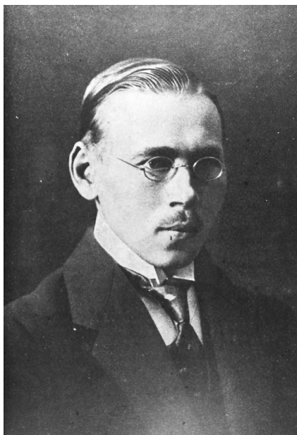
Joonis 2. August Rei.