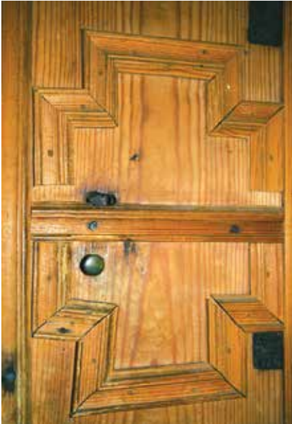
Foto 4. Korsi talu seinakapp Buldersi talus.