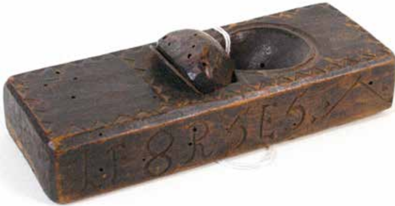
Foto 7. Ruhnu siluhöövel ERM A 426:2727 väiksemahulise ja peenema puutöö tegemiseks.

täheldatud ei ole. 19 Peremärkide sellise kasutamise vajalikkust põhjendab saarel kehtinud üldine töökorraldus. See oli korraldatud selliselt, et suuremad tööd tehti taludes ära ühiselt – talgute korras. (Steffenson 2006: 39.) Sügisest alates, kui paadid olid üles tõmmatud ja enam merel ei käidud, tehti töid talude juures – ehitati maju, tehti katust jne. Kuna suuremaid töid tehti peaaesjalikult talgute korras, olid talgulistel alati kaasas oma tööriistad (sammas). Sellest ka praktiline vajadus tööriistade märgistamiseks peremärkidega, et eristada enda talu tööriistu ja vältida nende segiajamist või kaotsiminekut. Küla üldise kogukondliku tegevuse taustal võib arvata, et vajadusel laenati tööriistu üksteisele, seetõttu oli tööriistade märgistamine samuti oluline. Vaatluse põhjal saab kinnitada, et peremärke on Ruhnus kasutatud praktiliselt igal puutööriistal (VM Bachman 2015).