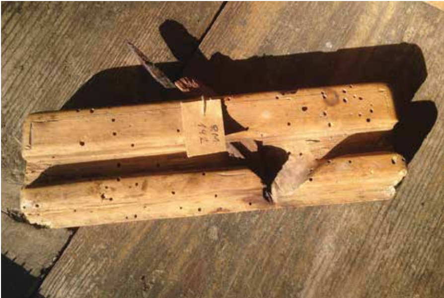
Foto 9. Profilhõvel RuM 142 Ruhnu muuseumis.

Ilmnes, et hõõvliid olid väga suurte erinevustega, mis määras ilmselgelt ka nende kasutusotstarbe. Hõõvliite suuruse ja säilinud tööriistade põhjal võib oletada, et suuremad pikk- ja härghõõvliid olid eelkõige paadiehituse ja suuremate laudsepatööde tegemiseks. Kergemad tööriistad leidsid kasutust ka mööbli valmistamisel.