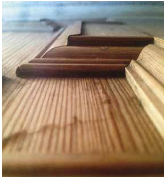
Foto 10. Ruhnu puukiriku altari puitprofiilid.

Muuseumides leitavat puutööriistade võrdlusmaterjali ei saa paraku pidada ammendavaks võrdlusallikaks. Säilinud esemete hulk ei ole võrrel- dav nende kunagise tegeliku igapäevase kasutussagedusega. Samuti mõjutab ERMi esemekogude koosseisu inimlik mõõde: olulised tööriistad kasutati n-ö lõpuni ära ja need ei jõudnudki muuseumisse. Vanavara kogumisretkedelt