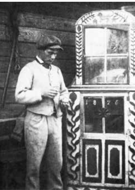
Foto 1. Magamisaida sisevaade koos selle sisustusse kuulunud aidakapiga.

etnograafiliste mälestustega, kust leiab viiteid mööbli ja töökorralduse kohta saare kinnises kogukonnas. Ainsa viite Ruhnu puutöökoja kohta leidsin samuti Steffensoni etnograafilisest ülevaatest „Meie, ruhnlased“, milles mainitakse puutöökoda Steffensi talus: „Ida-Steffensi talu puusepatöökoda oli esimene hoone, mis külateel ette jäi“ (Steffenson 2006: 68).