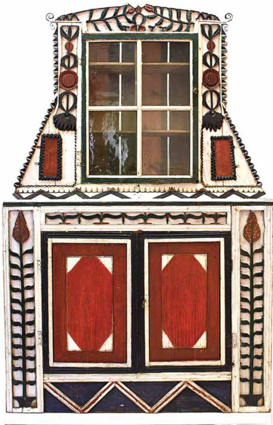
Foto 3. Steffensi talu aidakapp võrdlusdekooriga.