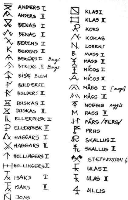
Foto 6. Ruhnu saare peremärgid. Koostatud Ruhnus ERKI praktikate raames 1976.

Peremärgiga märgistati Ruhnus perele kuuluvat vara. Peremärk tehti majale, paatidele, aerudele, tünnidele ja tööriistadele (Rußwurm 2015). Aastarve ja peremärke leiab siiani nii hoonete kui ka tööriistade pealt. Üldiselt pandi peremärk esemetele, mis võisid teiste talude varaga segi minna. Sellised esemed olid näiteks talgute ajal ka lauanõud ja lusikad; mööblil peremärke