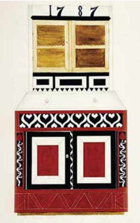
Foto 2. Buldersi talu aidakapp ERM EJ 424:17, mille dekoor on stiilikäsituselt sarnane Steffensi talu aidakapiga.

höövliga valmistatud profilliiste (Bachman 2009; VM Bachman 2016). Viimistlemata naturaalse puidu kasutamise tava on säilinud juba keskajast ja nende esemete ajaline dateerimine on Ruhnu traditsioonidepõhise kogukonna puhul keeruline, sest vanad stiilikäsitlused kestsid pikalt. 12 Tinglikult teise tüübina valmistati polükroomset ehk värviküllast ja rohkete lõigetega esindusmööblit, mille puhul on tugevad mõjud peamiselt Rootsi talupoja staatusmööblit saadud eeskujudel. 13 Rootsi talupojakultuuris oli 18. ja 19. sajandil rikkaliku maalitud dekooriga mööbel luksuse, see tähendab ka staatuse näitamise võimalus. Sellised mitmevärvilised kapid olid samuti omased Ruhnu mööblikujundusele 18. sajandi teisel poolel ja 19. sajandil (Õunapuu 1992). 14 Suurimaks erinevuseks oli dekoreerimise tehnika. Rootsi staatusmööbel oli värviküllaste maalingutega, Ruhnu mööbel aga rohkete lõikeornamentidega, mida selisel kujul leidub ainult Ruhnus.