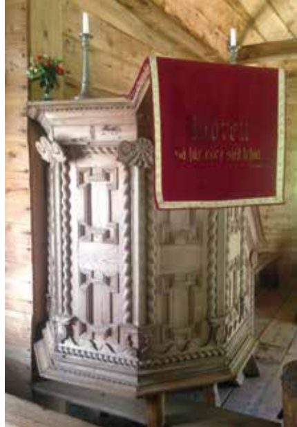
Foto 5. Ruhnu puukiriku kantli Korsi talu kapile sarnased puitprofiilid.

(fotod 1–3). Selliseid säilinud võrdlusprofiilidega kappe on Ruhnu mööbli hulgas alles kõigest seitse. Kasutades võrdlusmaterjalina ka eelmainitud etnograafilisi jooniseid, saab pidada kappe kõigi stiilitunnuste põhjal väga sarnasteks; nad võivad kuuluda ühe sajandi samasse valmistamisperioodi (Bachman 2009). 16