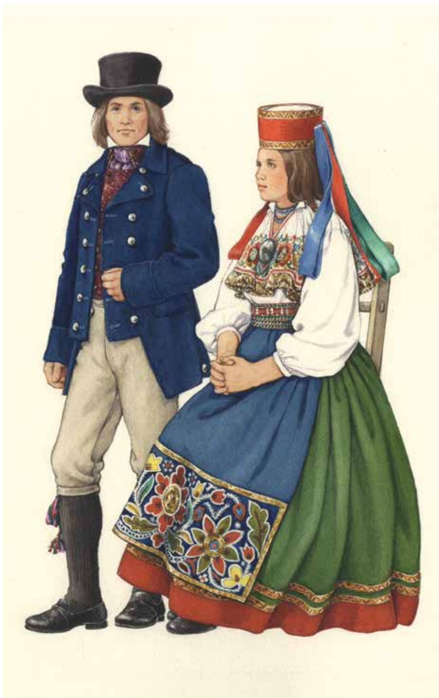
Joonis 4. Haljala kihelkonna mees 19. sajandi keskel ja Alutaguse naise rõivastus 18. sajandi lõpul või 19. sajandi algul (ERM EJ 415:14). Melanie Kaarma joonistus.