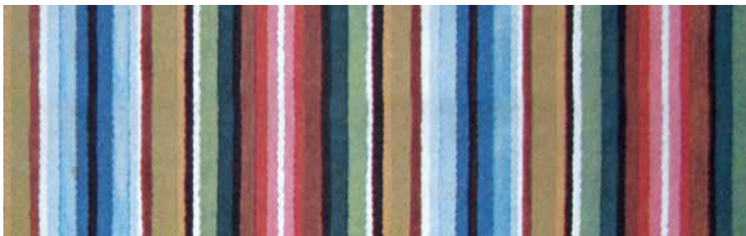
Foto 4. Simuna naisele kandmiseks soovitatud seelik. Nõukogude Naise 1968 nr 11 kaas.