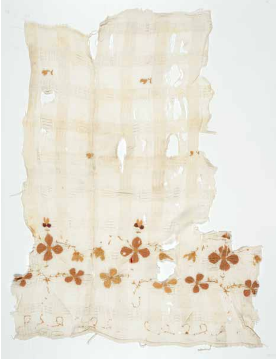
Foto 8. Kadrina põll ERM 16171.