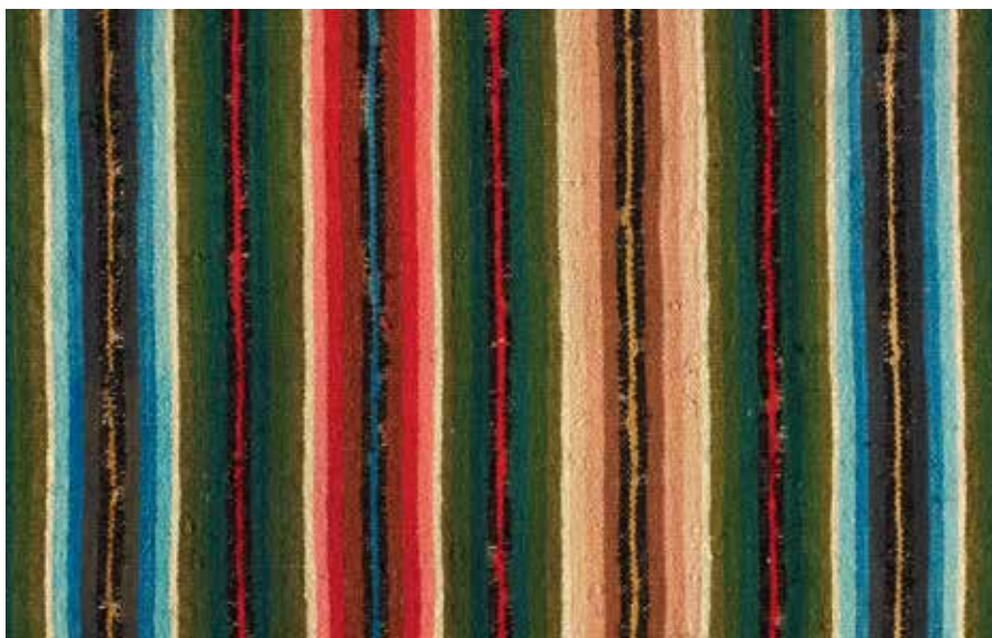
Striped skirt motif from Jõhvi (ERM A 509:1909).

Keywords: folk costume, traditional outfit, short blouse, sleeveless shirt.