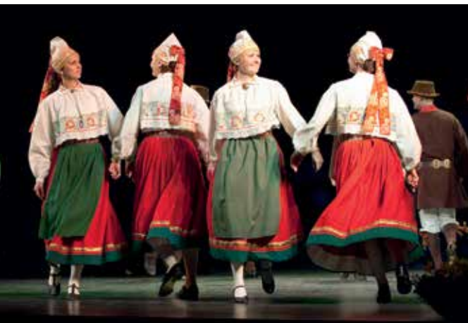
Foto 9. Tarvanpää põhiriühm.