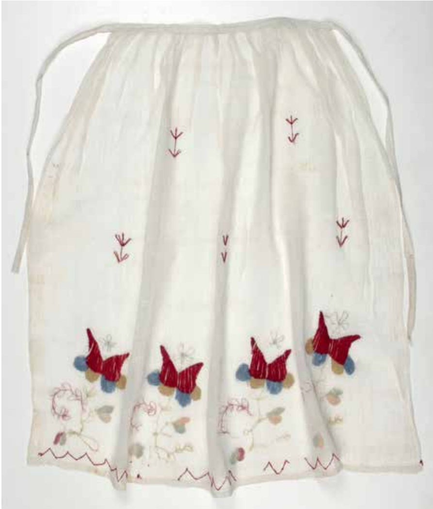
Foto 7. Kadrina põll ERM 16009.