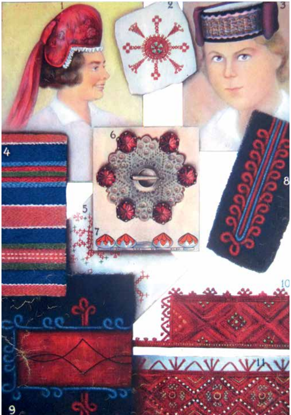
Joonis 1. Pottmüts (1), kõrvadega pärg (3) ja silmadega prees (6) Põhja-Eestist. Hilda Kamdroni joonistus ilmus Taluperenaise 1937. a. jaanuarinumbris.