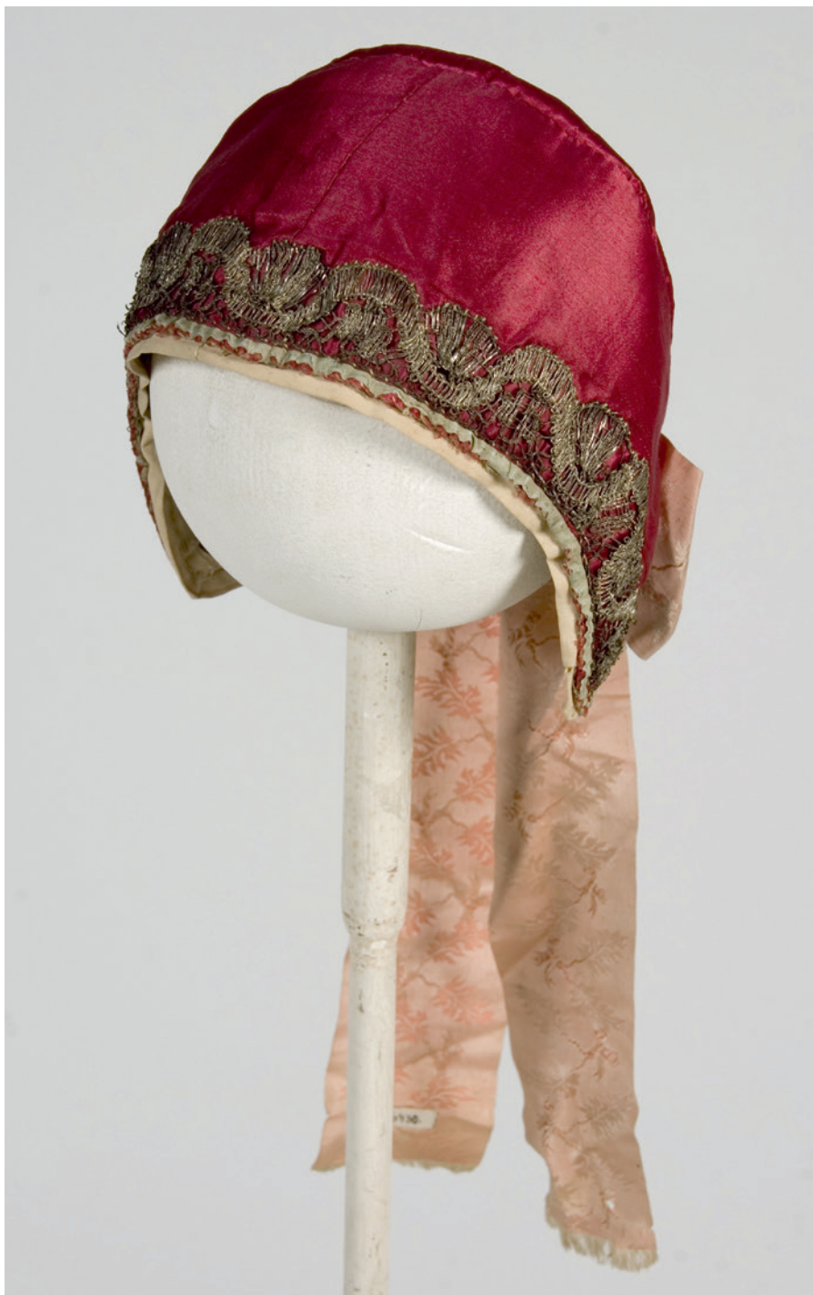
Foto 9. Metallpitsidega kaunistatud vanematüübiline müts Kadrina kihelkonnast, ERM 16430.