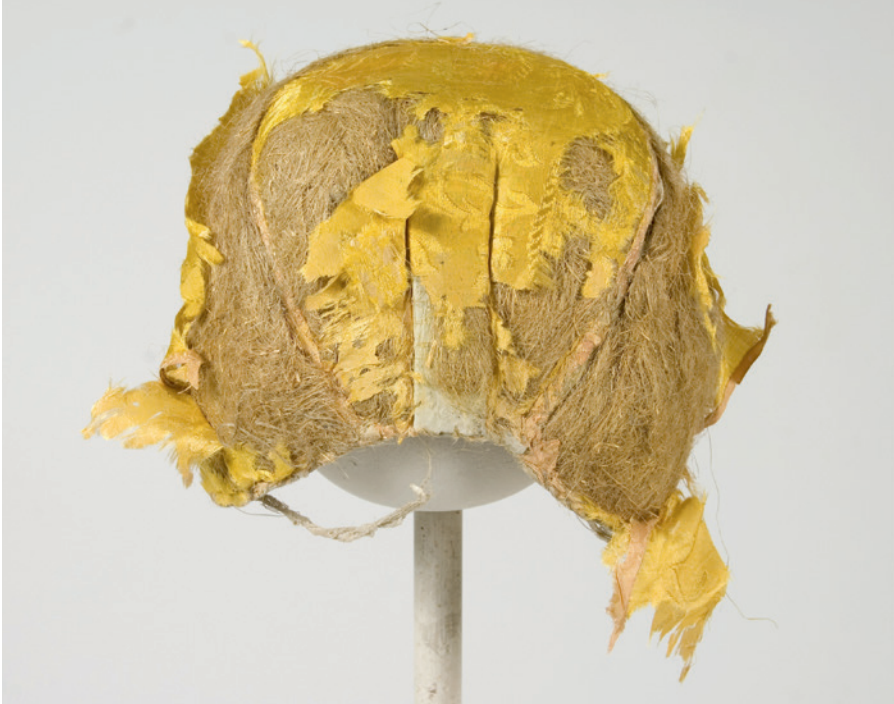
Foto 12. Türi pottmüts, ERM A 509: 4015. Katkise pealisiide tõttu on polsterdus näha.