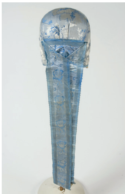
Foto 1. Pottmüts eest- ja tagantvaates. Peakate on ümara kujuga, eesäärde kinnitatud valge pits ehk treemel, kuklasse seatud lehvikujuuliselt lai siidpael. ERM A 291:517, Järvamaa.