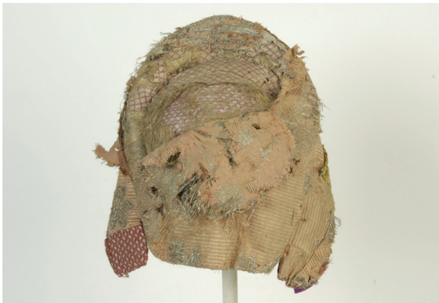
Foto 11. Kokošnik, ERM C 31:512, Venemaa. Katkise pealisriide tõttu on polsterdus näha.

kokošniku esitükki näitamaks, et selle peakatte esiäär võis olla nii lauge kui ka kumerusega otsaesisel.