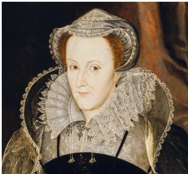
Foto 5. Maria Stuart, Šotimaa kuninganna. Tundmatu autori maal Nicholas Hilliardi järgi, 1578. National Portrait Gallery 429.

mist 20. sajandi algul valmistatud nii-öelda pott- ja kabimütse sarnaseid peakatteid, mis aga juba vale tehnoloogia kasutamisest tingituna kipuvad kandjal tantsides peast kukkuma või kõrvadele vajuma ja kuulmist segama.