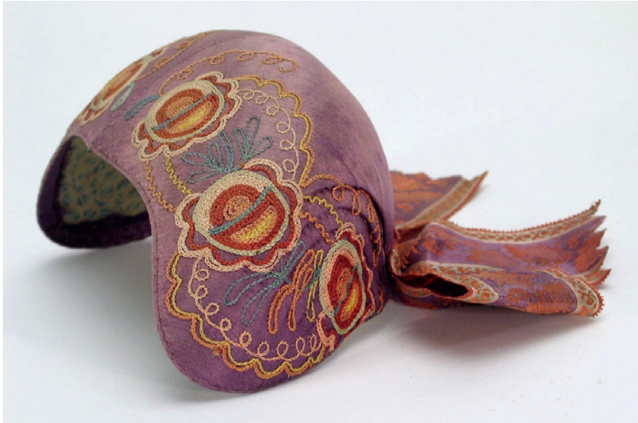
Foto 7. Rootsi bindmössa, Nordiska Museet 2710.

1510–1515 (Schuessler 2009: 131). Siiski peab ta peakatte algseks päritolu- maaks Hispaaniat, kust see levis Prantsusmaa kaudu mujale Euroopasse ja Skandinaavia maadesse (Schuessler 2009: 132).