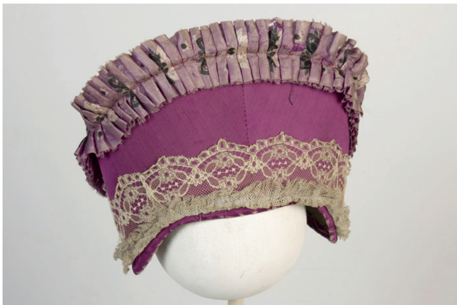
Foto 2. Pärnu-Jaagupi kabimüts, ERM 2006.