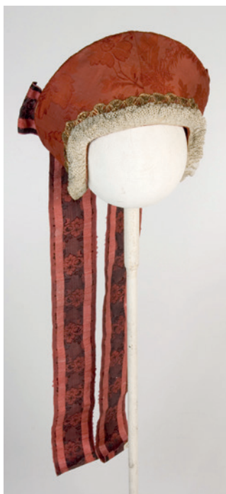
Foto 3. Vigala kabimüts, ERM 4047.