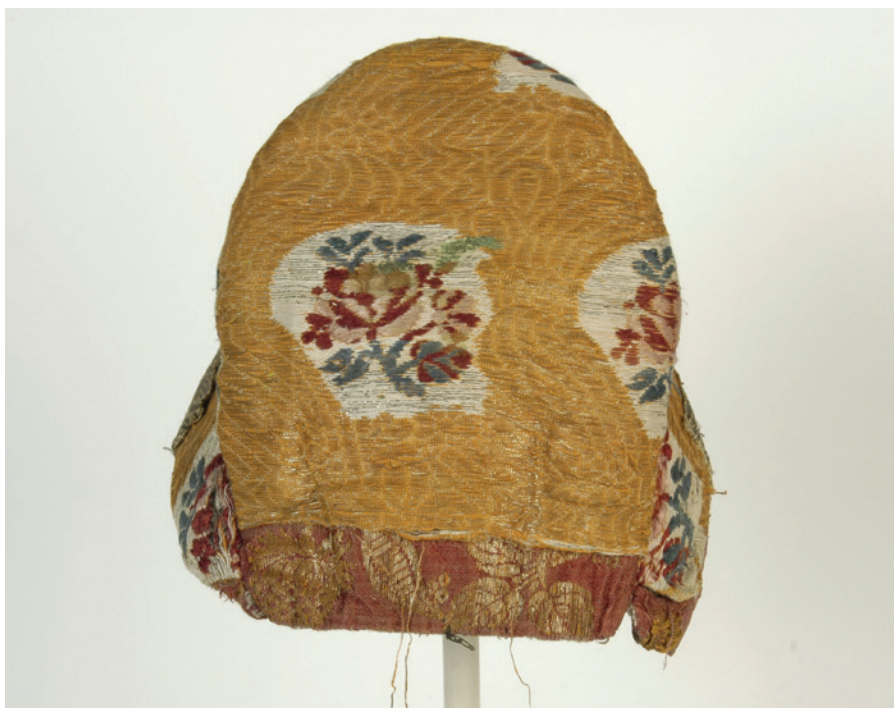
Foto 13. Kokošnik eest- ja tagantvaates, ERM C 31:502, Venemaa.