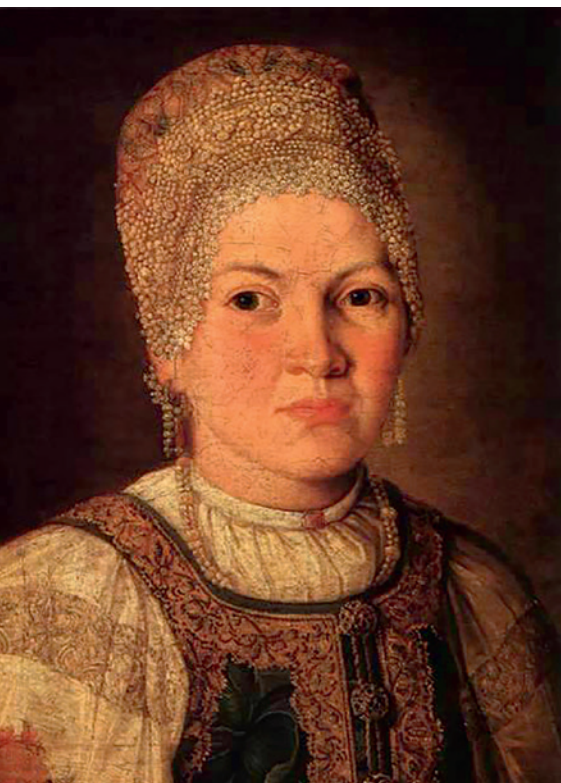
Foto 10. Naine kokošnikuga. Tundmatu autori maal, 1769. Vene Riiklik Muuseum, Ж-215.

Üheks oluliseks sarnasuseks meie naistemütsidega on kokošnikutel esiääre küljes sageli esinev kitsas pits. Soome ja Rootsi mütsidel on see pits ( tykki, stycke ) väga lai – algab poolelt pealaelt ning ulatub laubani.