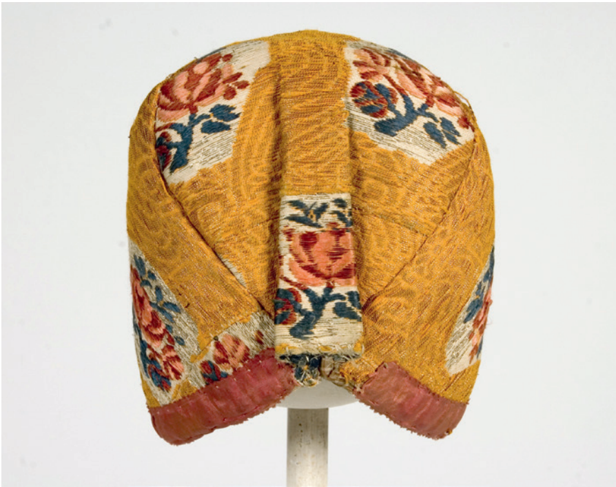
Foto 14. Jõelähtme pottmüts eest- ja tagantvaates, ERM A 509:3396.