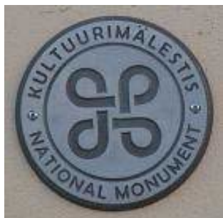
Foto 19: Kultuurimälestise märgis. [https://encrypted-tbn0.gstatic.com/images?q=tbn:ANd9GcT3z72eDqstuFrsYFk33wfR9iE3xbHrDBhxFJt_RwLLa5ba6Lc8BYNgzHfUrcPkC91aQ4M&usqp=CAU] 26.03.2023

Kivimite õppehoone valmis 2016 aastal. Ekspositsiooni toel saab siin põhjaliku ülevaate Hiiumaa maastikest, geoloogilisest minevikust, kivististest, Kärda meteoriidikraatrist ja kivimite kasutamisest läbi aegade. Õppehoonega sama katuse all asub väliõppeklass. Metsanduslik õppeklassi keskseks kohaks on väike infomajake selle ees olevate istepinkidega. See on sobiv koht aruteludeks ja väliõppe praktiliste tegevuste korraldamiseks. Õppeklassi tähtsaks osaks on 0,6 km pikkune õpperada, millel asub 14 infotahvliit. 65 Pärast väliseid tegevusi on alati võimalus suitsusaunas mõnusalt saunatada-leilitada.