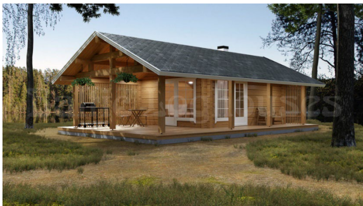
Foto 21: Simo-tüüpi saun-suvila, 21 m 2 . [ https://balticloghouses.ee/wp-content/uploads/2019/03/taustaga_05-keskelt-yle-1024x576.jpg ] 26.03.2023