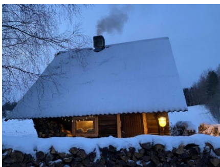
Foto 16: Talu saun Võrumaal Valgamaa piiril Karula Rahvusparkis Ähijärvel. [ https://cf.bstatic.com/xdata/images/hotel/max1024x768/337140780.jpg?k=e00a0ca54afd99a31e980dc9f0f85be5c1e2744a43e67164a38b76831137878e&o=&hp=1 ] 19.02.23

Fotodel 17 ja 18 on Hiiumaal, Soera Talumuuseumi 61 kompleksis olev suitsusaun (tänapäevaks ka kultuurimälestise märgiga 62 tunnustatud kui muinsuskaitse objekt).