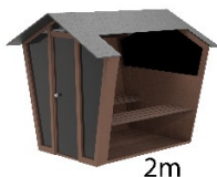
Foto 9: Panoraamvaatega leiliruum, mis mahutab lähedalt 6 inimest [ https://sumesauna.eu/wp-content/uploads/2022/03/Sumesauna-2m-mini-white-background.png ] 16.02.2023