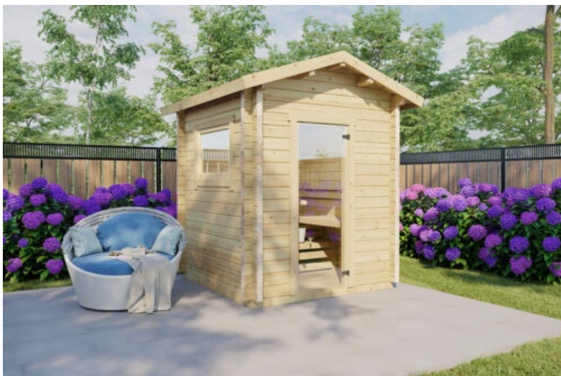
Foto 25: Välisaun, 4 m 2 . [ https://aiamaja24.ee/wp-content/uploads/2022/10/Valisaun-Simply-Sauna-1-70-mm-2-x-2m-500x333.jpg ] 26.03.2023