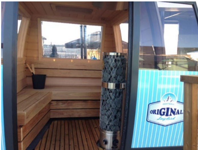
Foto 28. Astuge sisse! Kohe läheb söiduks ja leili viskamiseks ning vihtlemiseks! [ https://i0.wp.com/eestinen.fi/wp-content/uploads/2017/07/vaaterattasauna.jpg?w=1024&ssl=1 ] 24.03.2023