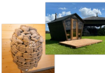
Foto 7: Sumesaun ja Foto 8: HUMO-keris; [ https://sumesauna.eu/tooted/ ] 16.02.2023