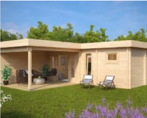
Foto 23: Aiasaun, 22 m 2 . [ https://aiamaja24.ee/wp-content/uploads/2017/02/Corner-Sauna-A-250x200.jpg ] 26.03.2023