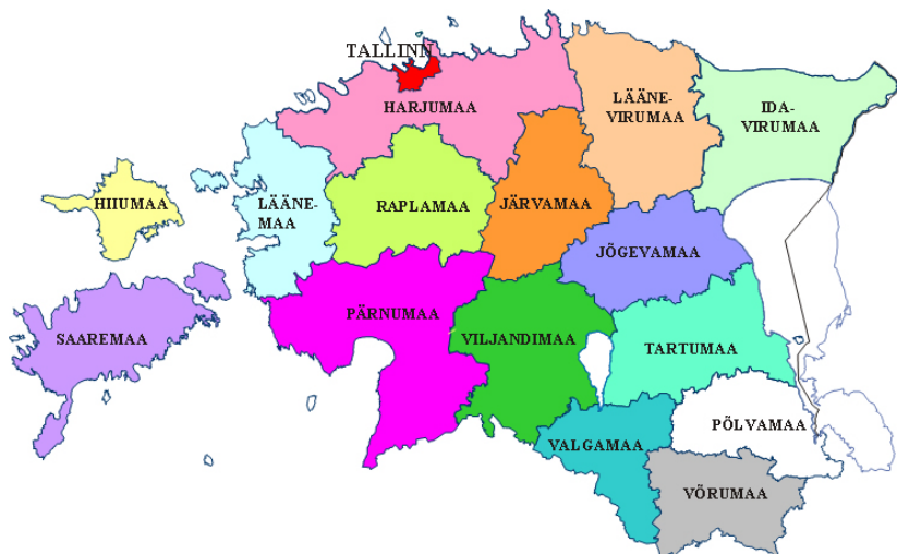
Joonis 1: Eesti maakonnad. [ http://s1.thingpic.com/images/R9/ZJyxwq2JJdNRgE3sMRTmDmJk.jpeg ] 12.02.2023