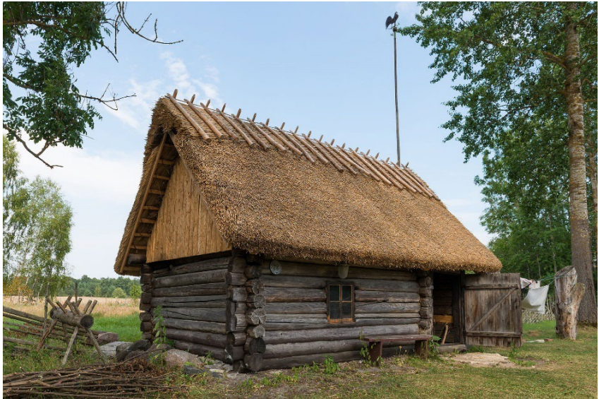
Foto 18: Rookatuse ja palkseinaga Soera talu suitsusaun Hiiumaal 2014. aastal (4.09.2014). (MR: saun pärast renoveerimist /oluline osa – rookatus/). [ https://upload.wikimedia.org/wikipedia/commons/thumb/8/88/Soera_talu_suitsusaun_Hiiumaal_2014.jpg/1920px-oera_talu_suitsusaun_Hiiumaal_2014.jpg ] 25.03.2023

Soera Talumuuseum moodustab 2016. aastast alates Palade Loodushariduskeskusega (Palade LHK) ühtse loodusõpet korraldava keskuse. Talumuuseum on säilitanud oma endised funktsioonid. 63