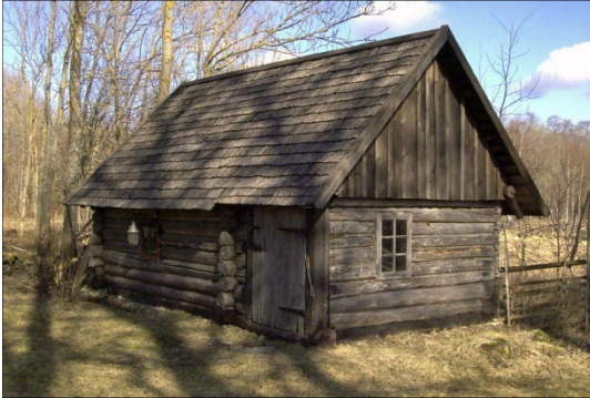
Foto 17: Soera talu suitsusaun enne renoveerimist. https://register.muinas.ee/public.php?menuID=monument&action=view&id=23603 2.09.2023