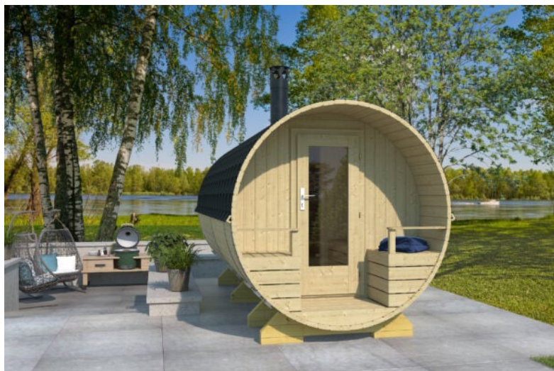
Foto 26: Torusaun „Kemi“, 8,4 m 2 . [ https://tene.ee/wp-content/uploads/2022/05/Kemi_ok-600x400.jpg ] 26.03.2023