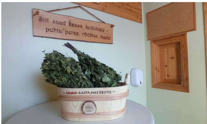
Foto 14: Saunapealinna karikas-vihavann tervitamas saunalisi Eesti esimese saunapealinna Kadrina sauna fuajees.