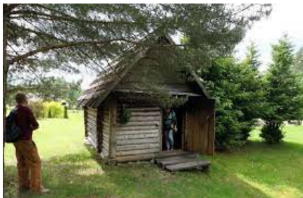
Foto 15: Hämsa talu suitsusaun Meegomäe külas, Võru lähedal. [ https://encrypted-tbn0.gstatic.com/images?q=tbn:ANd9GcRGzzKYQKvzaUCGJ_1bxY1K3RQF2NLKEwAA46HhGd69IuGLUtwP82vZWNr6X9X5wezPg&usqp=CAU ] 25.03.2023