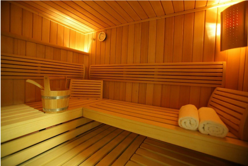
Foto 2. Eeskujuliku kaasaegse sauna leiliruum nii Soomes kui Eestis, aga mujalgi. [https://i0.wp.com/eestinen.fi/wp-content/uploads/2016/12/sauna.jpg?w=1920&ssl=1] 24.03.2023

„Kui küsida, mis usku on soomlased, siis võib öelda, et sauna usku. Soome on saunamaa ja soomlased on saunarahvas. Soomes on saunad igal pool: majades, korterites, suvilates, isegi büroohonetes, rääkimata hotellidest. Igas majapidamises on saun. Ja saunas käiakse vilkalt, paljudes peredes lausa iga päev.