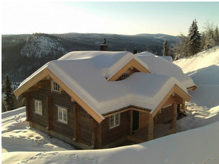
Foto 20: Simo-tüüpi palkmaja „Karl“ sauna ja terrassiga, 90 m 2 . [ https://balticloghouses.ee/wp-content/uploads/2018/09/Karl-90-Norway.jpg ] 26.03.2023

Järgnevalt mõned kaasajal eesti firmade poolt toodetud ja Eestis kasutatavad (ning ka eksporditud) saunatüübid näidetena: