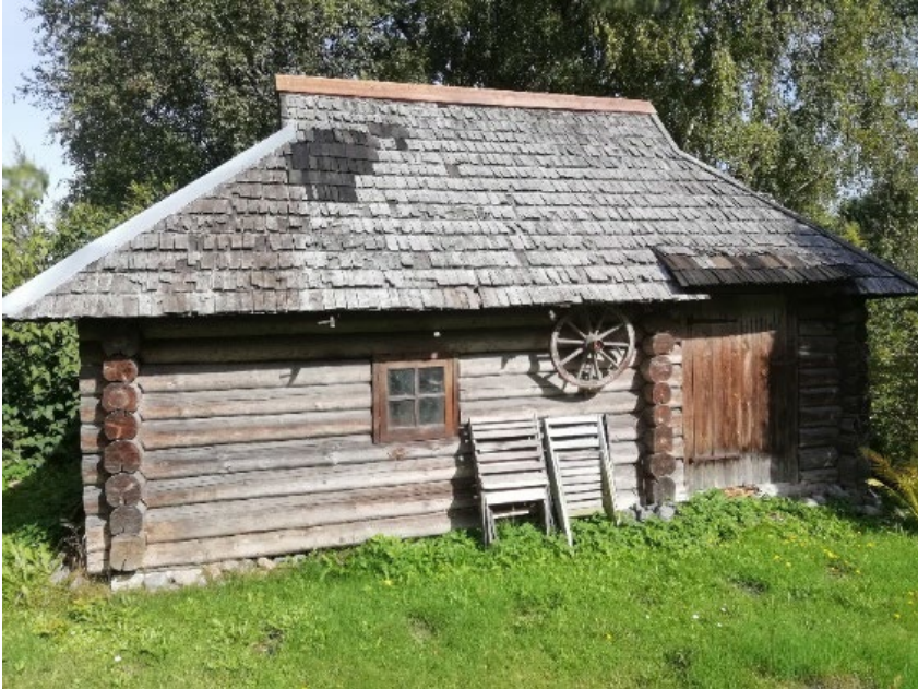
Foto 3: Suitsusaun MR koduaias aegadel). Puidust saunavarustus (külmavee tünn, pesunõud-palid, leili- ja veekapad jms) on Avinurme käsitöömeistrite valmistatud. 25

põhjapõdra sarvestest varnad-nagid) tegi allakirjutanu koos isaga, lisaks paigaldati elektrijuhtmed ja vastavad ühendused sauna eesruumis (valgustuse jaoks pimedatel