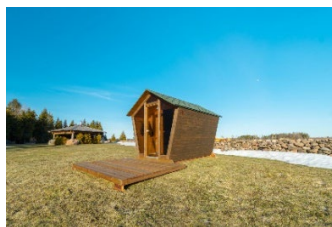
Foto 12: Sumesaun looduses [ https://sumesauna.eu/wp-content/uploads/2022/04/DSC_5710-Edit-scaled.jpg ] 16.02. 2023

Mobiilne lahendus: Teoreetiliselt võib Sumesauna kasvõi iga nädal uude kohta tassida. Praktiliselt tähendab see aga seda, et sauna paigutamine ei eelda vundamendi chitust ning seda on lihtne meelepärasesse kohta „maha istutada“.