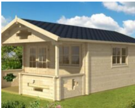
Foto 24: Saunamaja, 19 m 2 . [ https://aiamaja24.ee/wpcontent/uploads/2016/01/saunamaja-Mika-250x200.jpg ] 26.03.2023