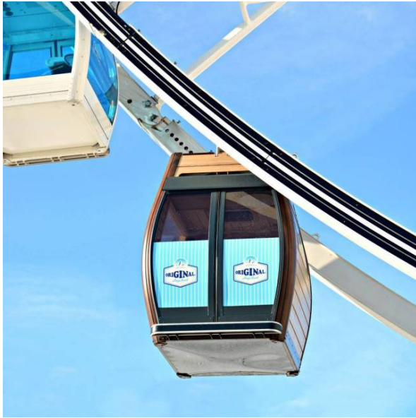
Foto 27. Helsingi vaaterattasauna – Skysauna. [ https://i0.wp.com/eestinen.fi/wp-content/uploads/2017/07/vaaterattasauna2.jpg?resize=768%2C768&ssl=1 ] 24.03.2023