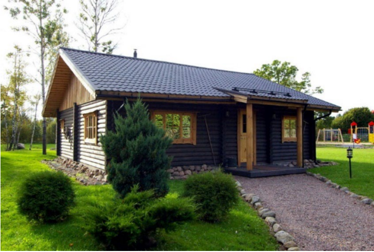
Foto 22: Kaasaegne saunahoone Harjumaal koos abi-, puhke- ja magamisvõimalustega. [ https://www.saunamaailm.ee/wp-content/uploads/2020/06/1254305628-930x620.jpg ] 25.03.2023