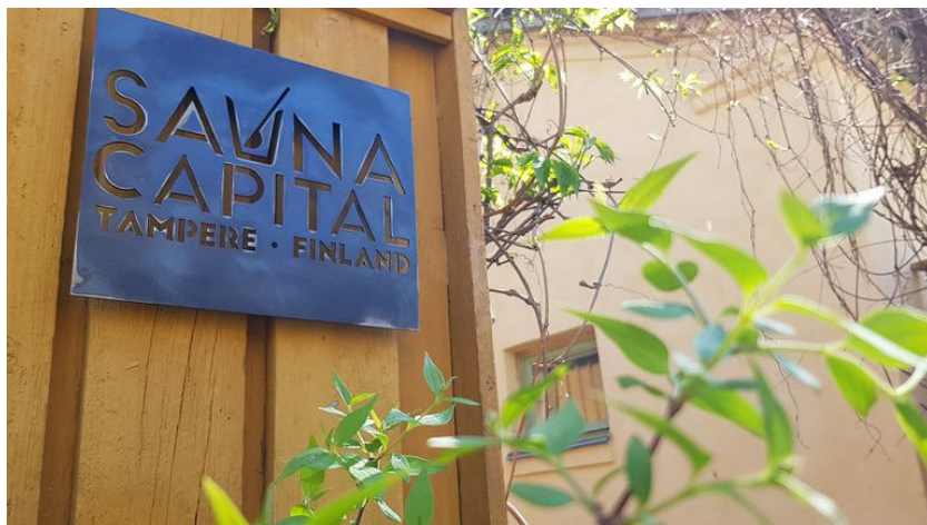
Foto 1: Tampere asub maailma saunapealinna esindav Soome vanim avalik tänaseni töötav saun. [ https://cdn.visittampere.fi/KGVaC3iHo6M_7J5dLJn-uh3lrUGE1pwZUzwiY6LNWqQ/rs:fill:768:432/plain/https%3A%2F%2Fvisittampere.fi%2Fwp-content%2Fuploads%2F2022%2F04%2FVisit_Tampere_Sauna_Capital_Sari_Makela-1.jpg ] 17.03.2023

Jyväskylä piirikoond on ka saunatööstuse keskus. Siin asuvad paljud saunadisaini ettevõtted toodavad saunade jaoks kõike vajalikku. Juulikuu esimesel nädalal toimuvad siin aga maailmameistrivõistlused saunakütmisses ja leilivõtmises (MR: millega on mõnel korral ka liiale mindud!?).