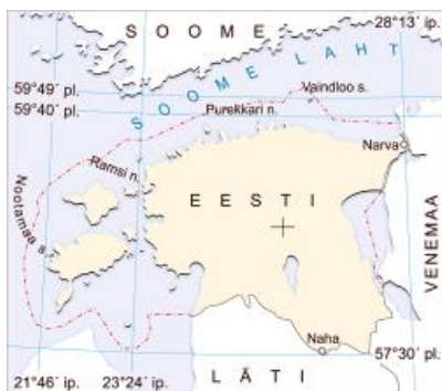
Kaart: Eesti äärmustipud ja kese. Rist tähistab Mandri-Eesti keset (58°41' pl ja 25°54'ip) 60