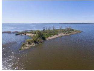
Foto 16: Tondisaar on saareke Võrtsjärve lõunapoolses osas. 63