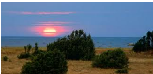
Foto 13: Sellist mereäärset kaunist loodusvaadet nagu kõrval oleval fotol Manilaiul, võib kohata Eestis väga paljudes kohtades (päikeseloojang mere ääres kadakasel karjamaal).

Edasi veel mõned fotod ja tekstid, mis võiks mõtteid meie majandusest läbi majanduspoliitika ja ettevõtetmajanduse tänasele ning tulevasele arengutegevusele viia.