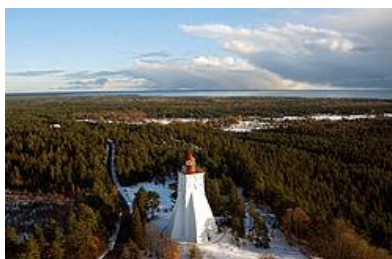
Foto 14: Kõpu tule torn Hiiumaal on üks maailma vanimaid, mille tipus on tuli pidevalt põlenud. 61 Vanuselt kolmas (rajati 1531)

isikutele kuulub 28% ja juriidilistele isikutele 20%. (Eesti metsad. [https://et.wikipedia.org/wiki/Eesti_metsad] 16.10.2025); MR: Puidu paremaks väärtustamiseks on meil veel palju reserve, sh puittoodete eksport!?