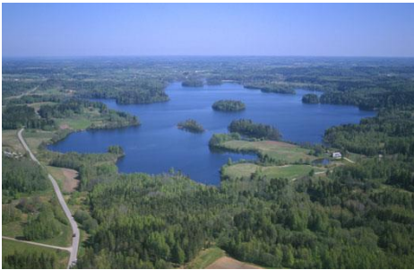
Foto 17: Pühajärv (Otepää Pühajärv), 64 Eestimaa kauneimaid järvi.