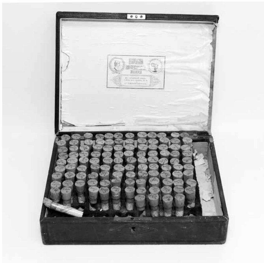
Foto 2. Homöopaatiline apteek. Центральная гомеопатическая аптека С.-Петербурга, ca 1914 (Viljandi muuseum, VM TA 35)

maste väljatõmbamiseks sõjaväes ja hiljem Iila küla elanike hulgas, Viljandi Muuseum saja aasta vanust homöopaatilise apteegi 7 komplekti, Valga Muuseum aadrilaskmise vahendeid ja kupuklaaside komplekti, tuntud kirurgi August Pobuli (1887–1959) 8 arstiriistade