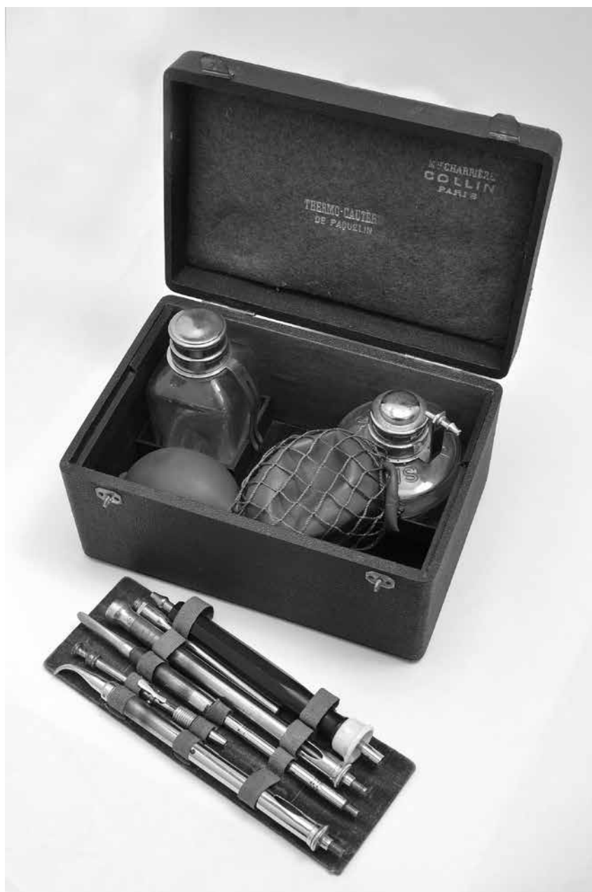
Foto 1. Seadmekomplekt operatsioonihaavade termoraviks Paquelini järgi. Thermo-Cautere de Paquelin. Mon Charriere Collin, Paris, ca 1889 (Narva Muuseum NLM 845/20)