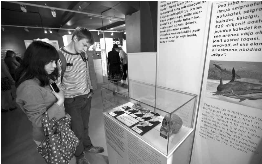
Foto 1. Näituse PEA ASI avamine 25. aprillil 2014.