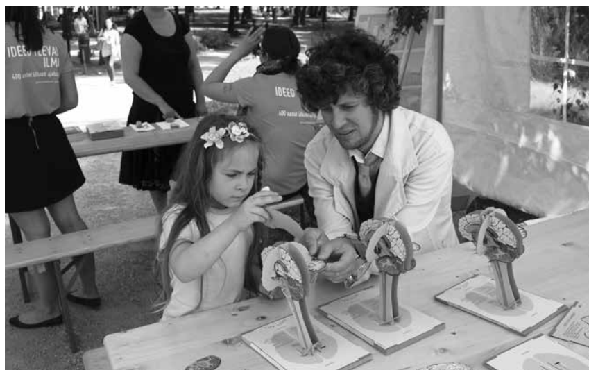
Foto 2. Hull Teadlane aitab hansapäevalistel papist aju kokku panna (Kätlyn Metsmaa foto).

Peaasi on iluasi? 29.06.2014–04.11.2014. Kuraator Kerttu Palginnõmm, kujundaja Anne Arus.