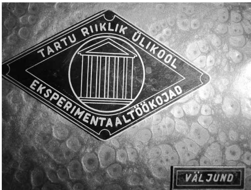
Foto 3. Detail näituselt „Tehtud Tartus“ – Tartu Ülikooli eksperimentaal-töökoja firmamärk.