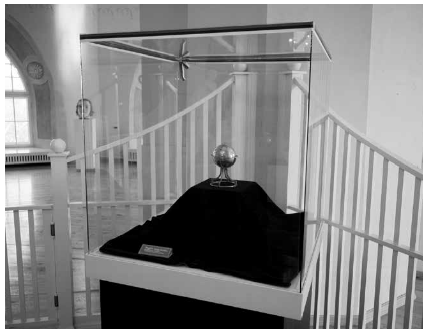
Illustratsioon 2. Araabia taevagloobus TÜ ajaloo muuseumi Morgensterini saali ekspositsioonis 1990. aastate alguses.

ne asukoht islamiusku tatarlaste keskusena kui ka keisririigi praktiline vajadus spetsialistide järele, kes tunneksid suurriigi mitteõigusklikest rahvaid. Kaasani ülikooli üldine õhustik ja tutvus Frähni jt oma ala tippteadlastega pidi mõju avaldama ka Erdmannile ja ärgitama tema orientalistikahuvi ning nii ei ole sellise kollektsiooni kujunemine just Kaasanis sugugi üllatav.