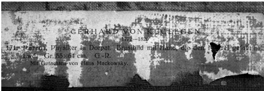
Illustratsioon 4. Rudolf Lepke oksjonimaja 1925. aasta kataloogist pärinev väljalõige maali tagaküljelt.

Maali nr 2 puhul osutus tähtsaks detailiks lõuendi tagaküljele kleebitud paberitükk (ill. 4), milles õnnestus tuvastada väljavõte Rudolf Lepke oksjonimaja 1925. aasta kataloogist. 22 Kahjuks puuduvad oksjonikataloogis andmed müüja kohta, kuid tõenäoliselt liikus maal oksjonile 1920. aastal surnud Arthur von Oettingeni pärijate käest. 23 Samuti on teadmata, kas maal õnnestus müüa ning kes oli maali omanik 1925. aasta oksjoni järel. Seega on periood 1925. aastast kuni 1940. aastate II pooleni maali nr 2 eluloos veel valge ala.