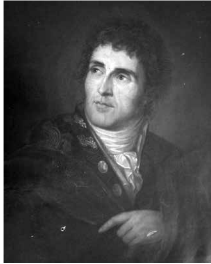
Illustratsioon 2. USA-st saadetud foto Parroti portreemaalist.

mast innustunud ja vaimustunud üliõpilaste initsiatiivil. Tudengite esialgne mõte ja soov oli eksponeerida Parroti vastvalminud portree ülikooli taasavamise teise aastapäeva puhul ehk siis 21. aprillil 1804. aastal. Sellega ülikooli nõukogu ei nõustunud, nagu ka võimaliku hilisema, postuumse eksponeerimisega. 8 Poleemikast, mille üliõpilaste ettepanek tollases äsja taasavatud Tartu ülikoolis põhjustas, saame elava ülevaate arhiivimaterjali abil. 9 Kirjavahetus Parroti portree asjus jõudis isegi keiser Aleksander I lauale, temagi esindusportree ülikooli jaoks maalis Kugelgen samal 1804. aastal. 10 Keisri portree tellimust vahendas Parrot ise ning hoidis valminud portreed hiljem oma eluruumides. 11 Maal, mis kujutas keisrit antiikses rõivas, on hävinud, kuid sellest on säilinud kirjeldused ja ka hiljuti leitud in-