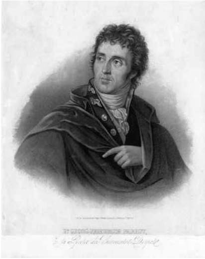
Illustratsioon 1. P. Smirnov, F. G. von Kugelgeni järgi, litograafia, 1853. TÜ raamatukogu, ÜR4493.