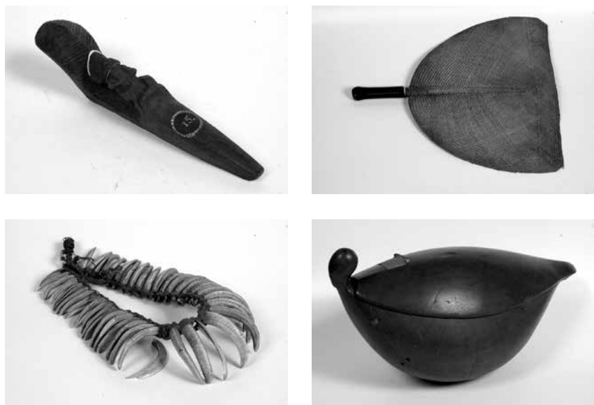
Joonis 3. Adam Johann von Krusensterni ümbermaailmareisilt pärit esemed Eesti Rahva Muuseumi kogus. Kõik fotodel olevad esemed pärinevad Nuku Hiva saarelt (ERM C 1:33, C 1:35, C 1:37, C 1:40).