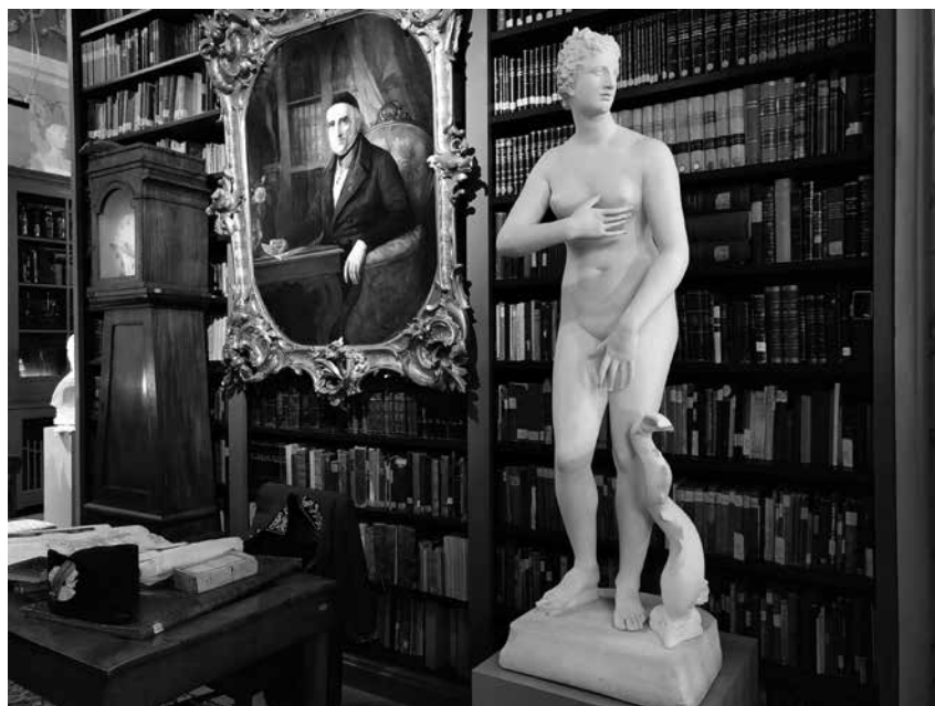
Joonis 2. Karl Morgensterni ajal ülikooli kunstimuuseumile hangitud Medici Venuse skulptuur näitusel „Minu elu ülikool“.