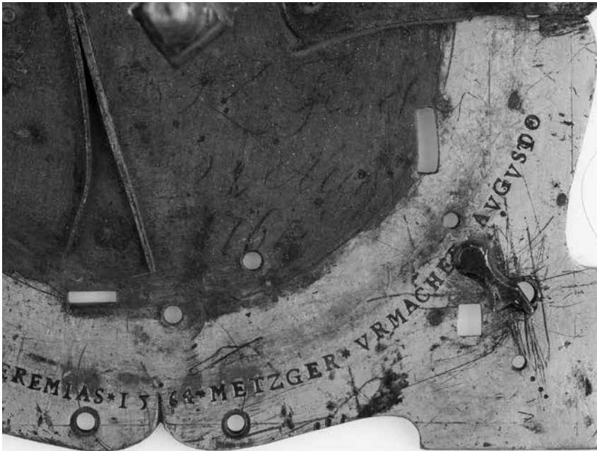
Joonis 6. J. Z. Fischeri parandusmärg 1764. aastast kella korpuse kaane all.