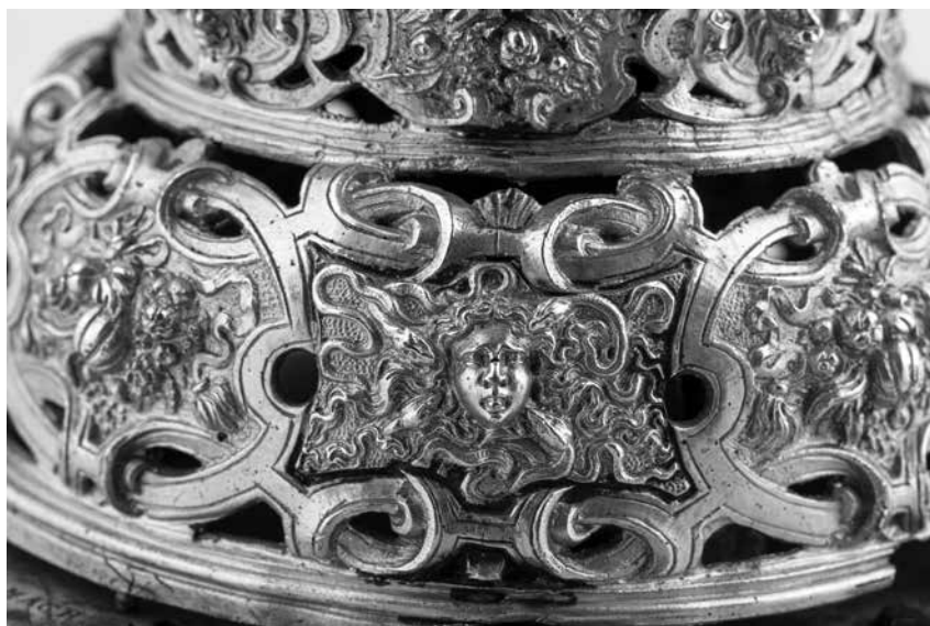
Joonis 12. Kuplit kaunistav gorgo.