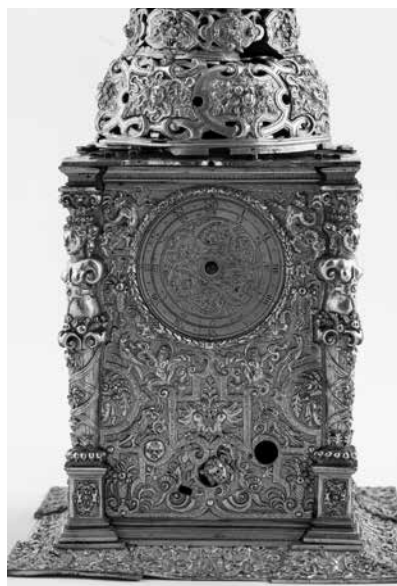
Joonis 9. Kella tagakülg.