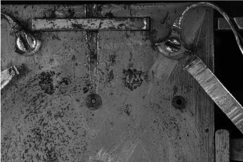
Joonis 4. Jeremias Metzgeri firmamärk IM ja kella kvaliteeti tunnistav nn Augsburgi piiniakäbi kella korpusel.