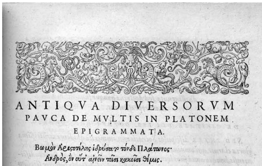
Joonis 15. Stephanuse Platoni editioon TÛ raamatukogus.

oli Morgenstern oma isiklikku raamatukogusse ostnud Stephanuse 1578. aastal välja antud Platoni teoste kreeka- ja ladinakeelse väljaande. 19 Sarnaste motiividega ehisliste ja vinjette selles tööpoolest leidub, kuid nagu öeldud, oli groteski kasutamine raamatukunstis 16. sajandil laialt levinud ning otsest seost Stephanuse Platoni-editiooni ja kella vahel pole.