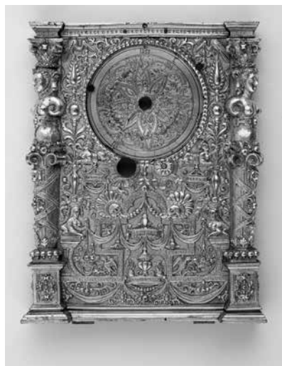
Joonis 11. Kella parem küljeplaat.