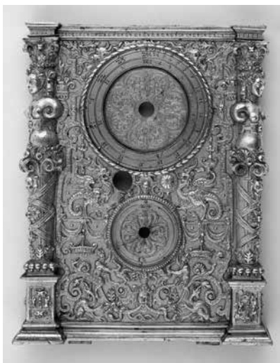
Joonis 10. Kella vasak küljeplaat.