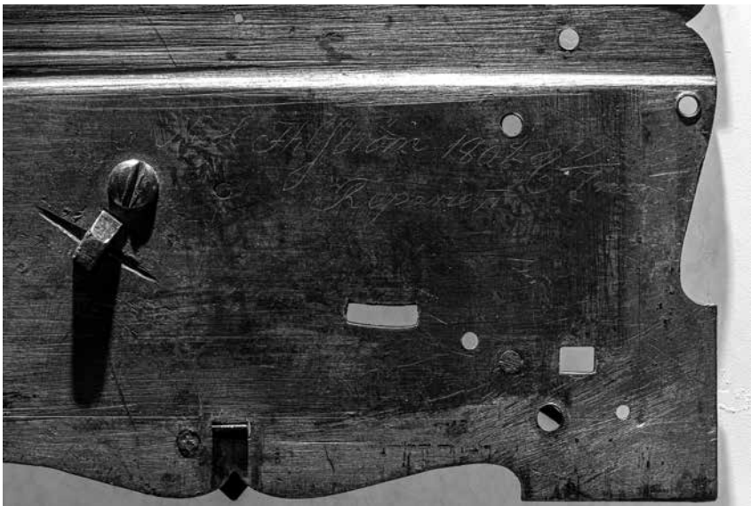
Joonis 7. Nicol Ihlströmi parandusmärg 1802. aastast kella põhja all.