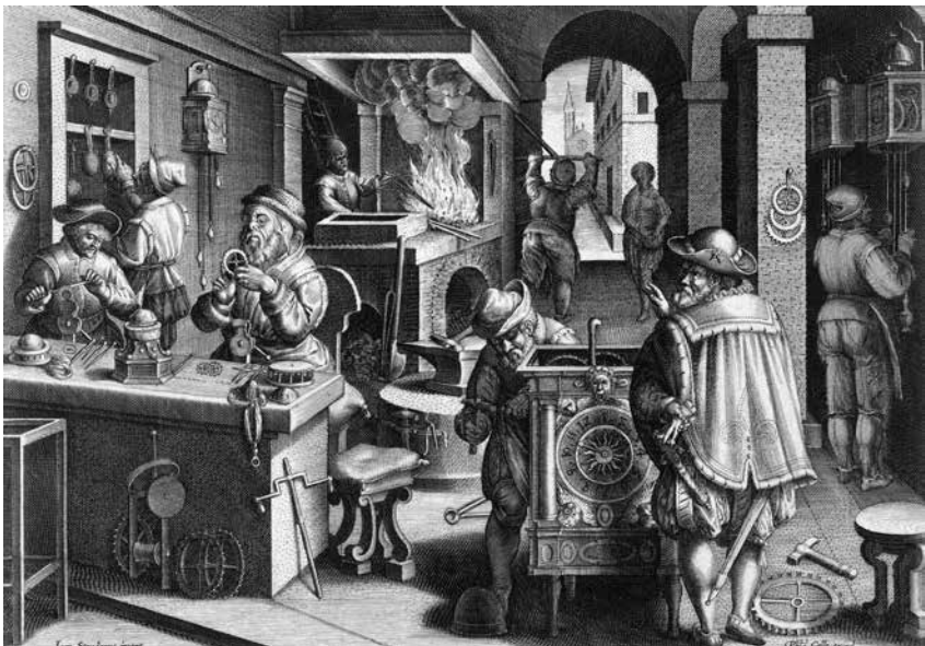
Joonis 3. Philips Galle töökoda. Kellameistrid. Jan van der Straeti järgi sarjast „Uued leiutised ja avastused“ (Nova reperta). Vahemikus 1589–1593. Vasegravüür (Rijksmuseum, Amsterdam). http://hdl.handle.net/10934/RM0001.COLLECT.115333