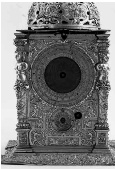
Joonis 8. Kella esikülg.