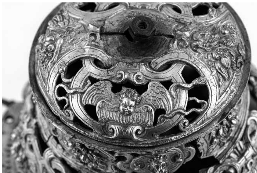
Joonis 13. Kuplit kaunistav keerub (A. Tennuse foto).