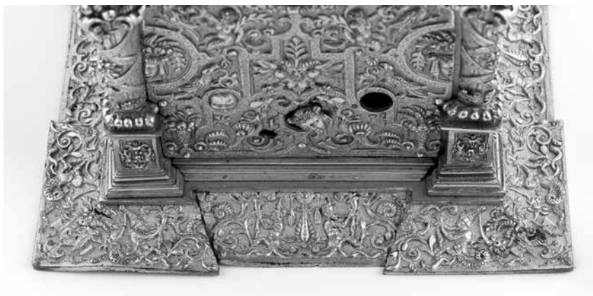
Joonis 14. Kella põhjaplaat.

mille ülaosa moodustab naise poolfiguur (nn terminus ). Põhjaplaat on kaunistatud väänlatega.