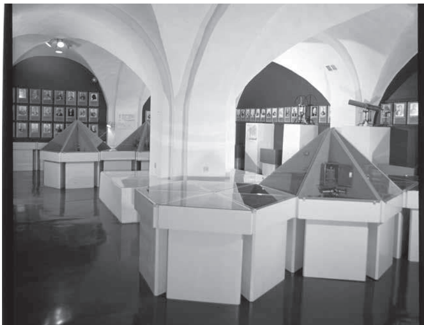
Foto 2. TÜ ajaloo muuseumi esimene ekspositsioon avati ülikooli peahoone keldris 1. aprillil 1980

seumi tegutsemise algusajaks. 20 1803. aasta 2. septembril ilmunud põhikirjas kinnitati ülikooli kunstimuuseumi loomine, haldamine ja eelarve. Ülikoolimuuseumide kogud olid avatud ka ülikoolivälisele publikule. Esimesena avati loodusteaduslikud kogud: juba 1803. aasta teise semestri loengukavas soovitati huvilistel pöörduda loodusteaduste professori Gottfried Albrecht Germanni poole, et tutvuda looduskabineti ehk loodusmuuseumiga (ametlikult Naturalien Cabinet ehk ( Akademische ) Naturhistorische Museum ). 200 aastat tagasi oli loodusmuuseum huvilistele lahti kõigil kolmapäevadel ja laupäevadel kell 14–16. Aastast 1805 oli ametis esimene ülikooli