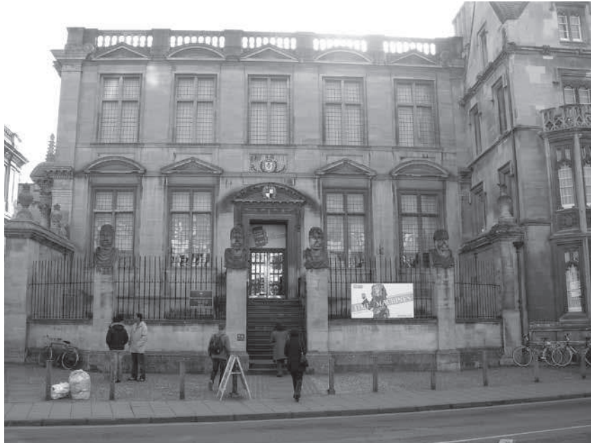
Foto 1. Ashmole'i muuseumi peetakse vanimaks ülikoolimuuseumiks maailmas. Alates 1924. aastast paikneb vanas Ashmole'i muuseumi hoones Oxfordi ülikooli teadusajaloo muuseum

oma avaliku rolli üle. Seega on ülikoolimuuseumidel kaks lähtekohta ning ka kaks arenguteed, kuid muutused 21. sajandil on näidanud, et neid kahte suunda on osatud edukalt ühitada.