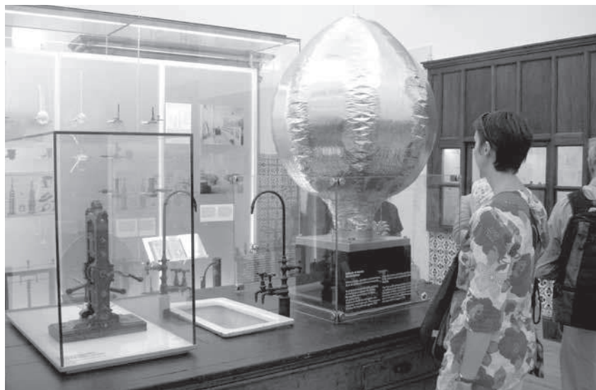
Foto 4. Coimbra Ülikooli teadusmuuseum paikneb ajaloolistes keemia- ja füüsikahoonetes. Kaasaega ja mineviku omavahel hästi siduv püsiekspositsioon Laboratorio Chimico 's kõneleb materia ja valguse saladustest

1970. aastatel. 37 Peale selle, et rajati uusi muuseume ning senistes muuseumides tehti uuendusi, loodi ülikoolide algatusel või koostööna hulk teaduskeskusi, et võimalikult professionaalselt jagada teadmisi oma kaasaja teadusest. Ka Ahhaa teaduskeskus kasvas välja Tartu Ülikoolist, toimides pikka aega Tartu Tähetorni ruumides. 38