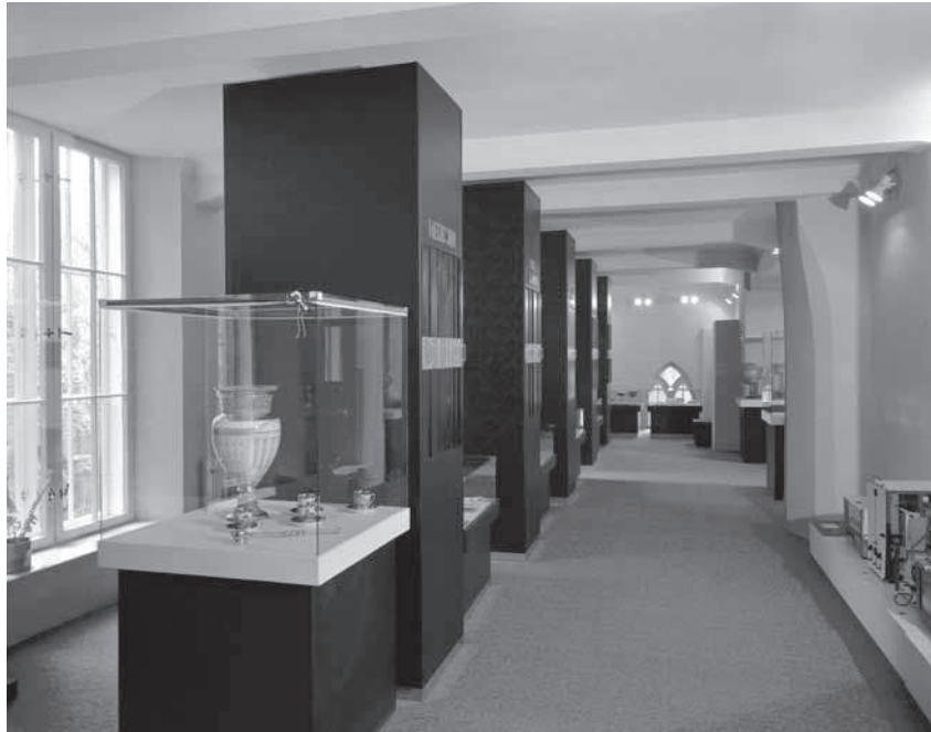
Foto 3. TÜ ajaloo muuseumi kaasaja saal, 1991

viitab kunagisele Aleksandria mouseion 'ile. 32 Siiski iseseisvusid need alles 19. sajandi teisel poolel maailmanäitustest välja kasvanud teadus- ja tehnikamuuseumidena, mille olulisim inspiratsiooniallikas oli nii teaduse kui ka tööstuse kiire areng. 33 Järgmisel sajandil kujunesid nende kõrvale ka ülikoolide teadusmuuseumid, täpsemalt teadusloomuuseumid. Nende loomise põhiajend oli tahe talletada vanu õppe- ja teaduskollektsioone. Enne muuseumi võis selliseid ajaloolisi kogusid leida tavaliselt koridorides, klassiruumides, kabinettides jm. Enamasti oli teadusloomuuseumi palju keerulisem rajada kui neid, mis kujunesid õppe- ja teadustöö tulemusena loomuliku arengu käigus. Esimeste seda tüüpi muuseumide hulka kuuluvad Strasbourgi ülikooli juures asuv seismoloogia- ja Maa magnetismi muuseum (1900), Lyoni ülikooli meditsiini ja farmaatsia ajaloo muu-