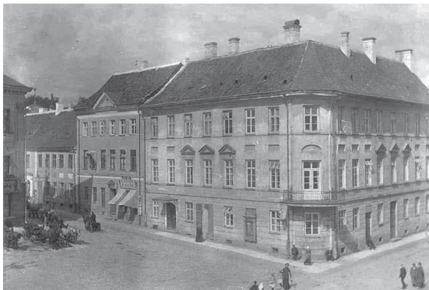
Illustratsioon 4. Suurturu-äärne vana ülikoolimaja 1870. aastal