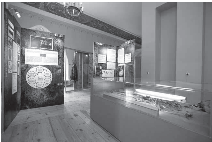
Foto 1. Näituse „Kukruse kaunitar ja tema kaasaegsed: Eesti rikkalikem kalmistu muinas- ja keskaja piirilt“ üldvaade.