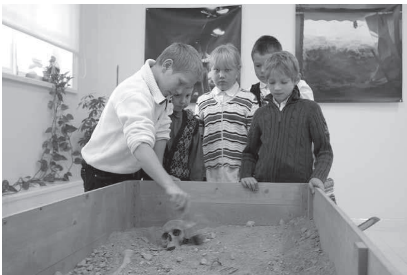
Foto 2. Arheoloogia näitusel said igäüks ise arheoloogi tööd proovida