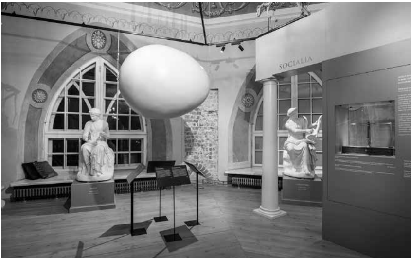
Foto 4. Näituse jaoks palusime nelja eri valdkonna teadlastel vastata, kuidas nemad teaduslikust vaatepunktist seletaksid muna tähendust.