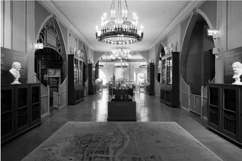
Foto 1. Näitus „Minu elu ülikool“ paikneb Tartu Ülikooli muuseumi Morgensterni saalis, kus on kõige ehedamalt säilinud ülikooli arhitekti Johann Wilhelm Krause ruumikujundus.