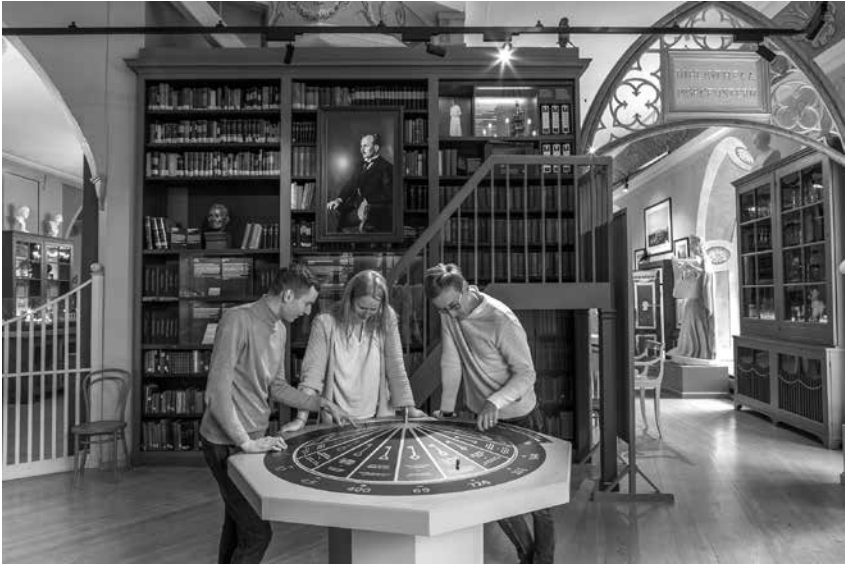
Foto 3. Ajaloolisse keskkonda sobitub hästi mehaanilist interaktiivsust kasutatav lahendus nagu seda on 1919. aasta võtmefaktide mäng.