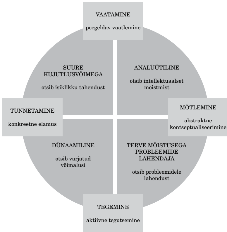
Joonis 2. Õppimisstiilide ja õppijate tüübid. (Cassels, 1996)

näituseosadele, mis teist tüüpi õppijal võiks muidu märkamata jääda.