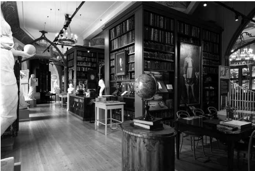
Foto 2. Sisekujunduslahenduse üheks eesmärgiks oli elustada suurejooneline raamatukogu interjäär.