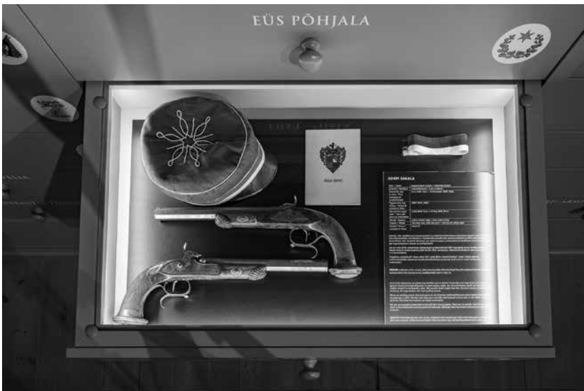
Foto 8. Osalusprojektina palusime kõigil täna tegutsevatel akadeemilistel organisatsioonidel oma looga täita sahtel. Sahtlite sisustamisel kasutati esemeid nii muuseumi, teiste mäluasutuste kui ka organisatsioonide endi arhiividest ja kogudest.