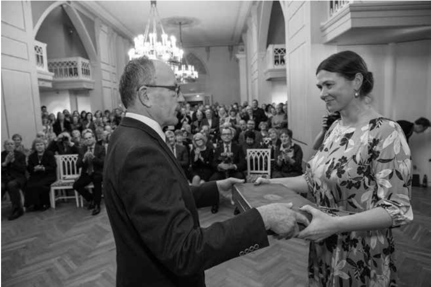
Foto 7. Näitus avati 29. novembril 2019 osana Rahvusülikooli sajandat sünnipäeva tähistavate ürituste sarjast.