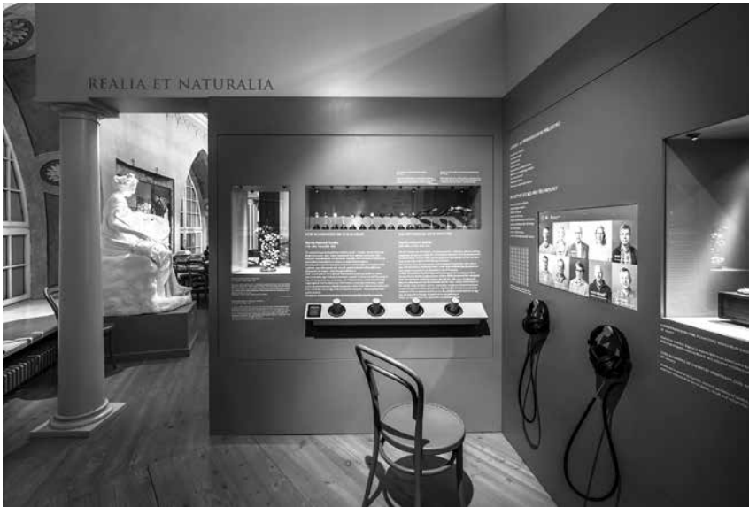
Foto 5. Nelja valdkonna ristic on omavahel ühendatud üks oluline teadussaavutus, valdkonna tänane struktuur ning osalusprojektina valminud teadlaste minutiloengud oma uurimisteemal.