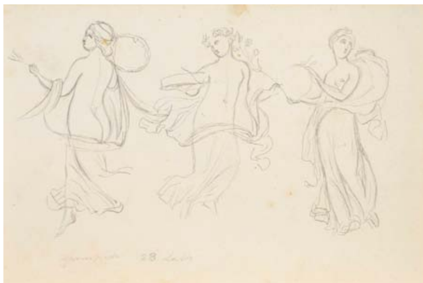
Abb. 8–9. Otto Friedrich von Moellers Zeichnungen mit Pompeji-Themen aus den vierziger Jahren des 19. Jahrhunderts in der Graphiksammlung des Estnischen Kunstmuseums.

Zum Schluss sei hier noch erwähnt, dass am Vorabend des Zweiten Weltkrieges die an den Wänden des Gutshofs Sall hängenden Ölskizzen mit Pompeji-Thema durch den Erben des Künstlers Otto Friedrich