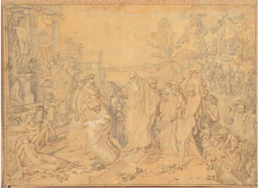
Abb. 7. Otto Friedrich von Moellers Entwurf des Gemäldes „Der Apostel Johannes predigt auf der Insel Patmos den Bacchanten“.

des 19. Jahrhunderts – Raffael – zu erkennen ist, kann gleichzeitig auf der heidnisch-bacchanalischen Seite das Echo der Wandgemälde Pompejis wahrgenommen werden. Wie der Künstler sich von den Vorbildern Pompejis entfernte, wie er seinen künstlerischen Weg beschritt, indem er die Kunstgeschichte zitierte, zeigen die in der Graphiksammlung des Estnischen Kunstmuseums erhaltenen Bleistiftskizzen von Frauen, die zur Begleitung von Paukenmusik tanzend schweben (Abb. 8, 9 12 ).