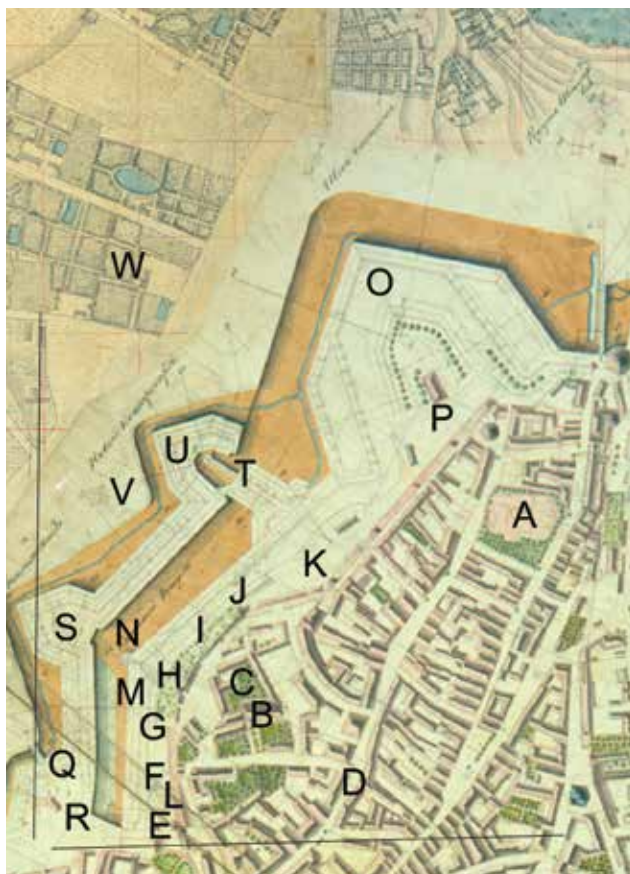
Abb. 3. Plan des Jahres 1825 (Fragment)

Extra erwähnt werden sollte vielleicht nur der unmittelbar vor der Stadtmauer verlaufende Nonnenwall (estnisch: Nunnavall) mitsamt dem steinernen Verteidigungsbau, der sich in seiner Biegung ungefähr vor dem Turm der Goldene Fuß (estnisch: Kuldjala torn) befand. Bei den frühen, für die Kanonen angepassten Befestigungsanlagen und den frühen Bastionärbefestigungen in Alt-Livland (in allgemeinen Zügen das heutige Staatsgebiet von Estland und Lettland) handelt es sich eigentlich um ein bisher wenig erforschtes Thema, das im Rahmen des vorliegenden Beitrags nur markiert werden kann. Ein verdienstvoller Forscher der mittelalterlichen Stadtbefestigungen von Reval, der Architekt Rein Zobel, interpretierte diesen Wall in seinem letzten, noch zu seiner