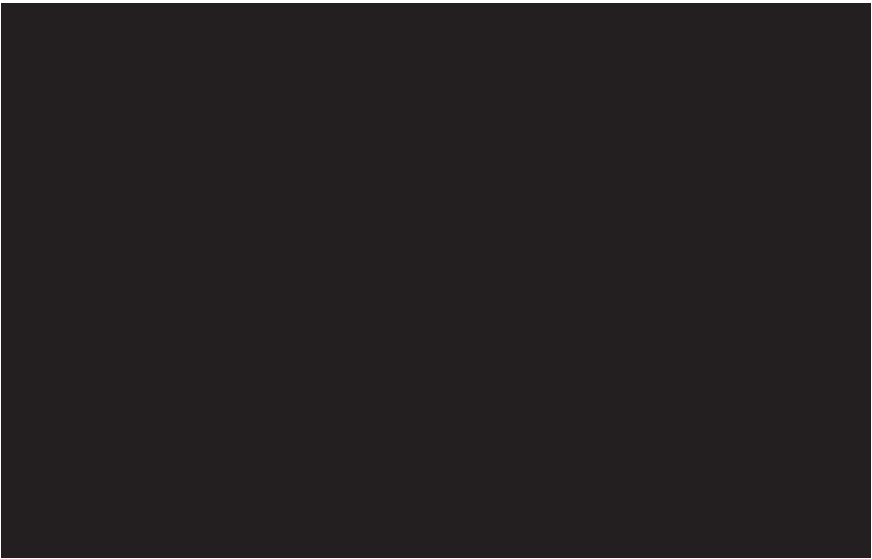
Abb. 4. Der Grundriss der Kirche von Luggenhusen mit den Bauetappen und dem vermuteten Gewölbesystem. Zeichnung von Raul Vaiksoo

zentralen Akteuren, deren erste große Arbeit der Umbau des Rathauses in den Jahren von 1402 bis 1404 war. Diesen Revaler Meistern war eine Verwendung von Bauformen zueigen, die sich über eine lange Zeit nicht änderten. Unter anderem sticht die konservative Bevorzugung von Gratgewölben ins Auge. Ein besonders sicheres Kennzeichen wurden aber