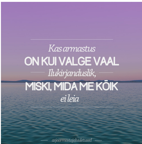
Joonis 3. Tumblri luule #asjaarmastajaluuletused. 4

Ka eesti Tumblri ja Instagrami luuletajate teosed on multimodaalsed, enamasti on ühendatud tekst pildiga. Näiteks Tumblri kasutaja #asjaarmastajaluuletused ühendab teksti kauni looduspildiga (vt Jõemets jt 2020, joonis 3).