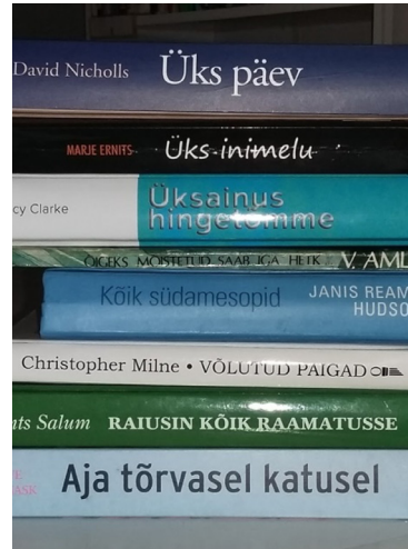
Joonis 6. Raamatuseljaluule. Näide blogist „Loetu kaja”. 7

Kokkuvõttes võib öelda, et multimodaalsus on sotsiaalmeedia kirjanduse puhul üks silmatorkavamaid omadusi, lisaks kirjeldatud Tumblr ja Instagrami luulele esineb multimodaalsust ka Facebooki luule või proosateoste puhul, ilukirjanduslikes blogides jm.