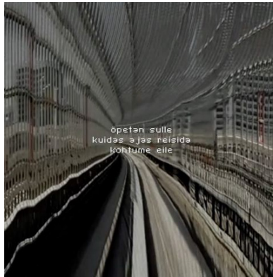
Joonis 4. Kuvatõmmis kasutaja Aegruum Instagrami kontolt. 5